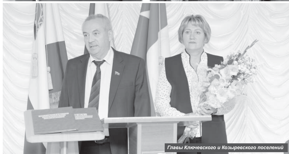
Главы Ключевского и Козыревского поселений