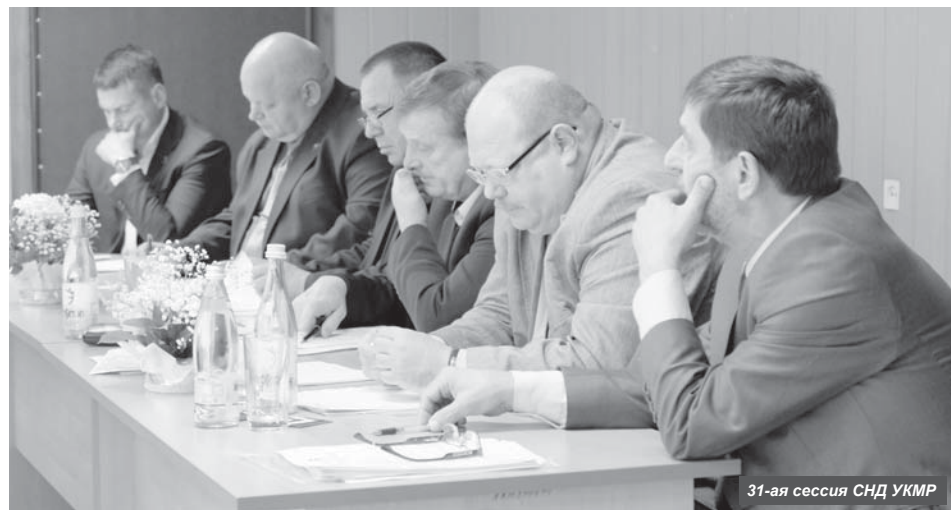
31-ая сессия СНД УКМР