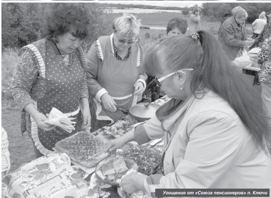
Угощения от «Союза пенсионеров» п. Ключи