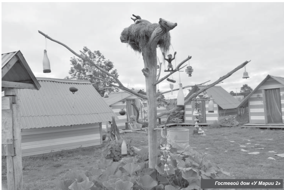
Гостевой дом «У Марии 2»