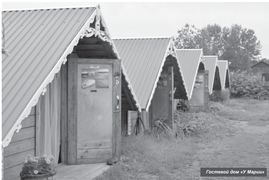
Гостевой дом «У Марии»