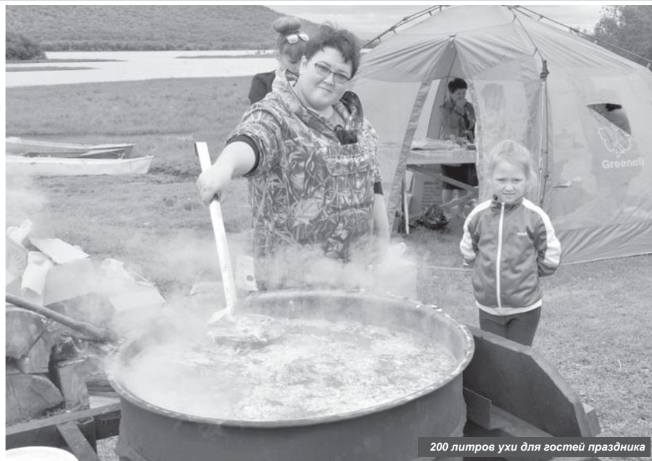
200 литров ухи для гостей праздника