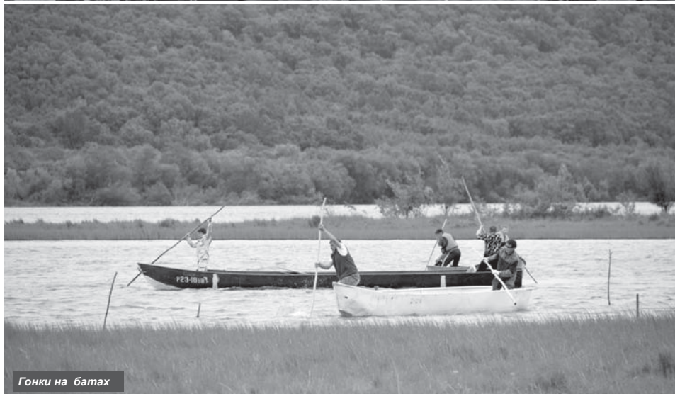
Гонки на батах

День аборигена – одно из любимейших торжеств местных жителей. Таинственный, необычный и, конечно, колоритный... С каждым годом он собирает вместе всё больше людей, которые с интересом наблюдают и участвуют в предложенных забавах.