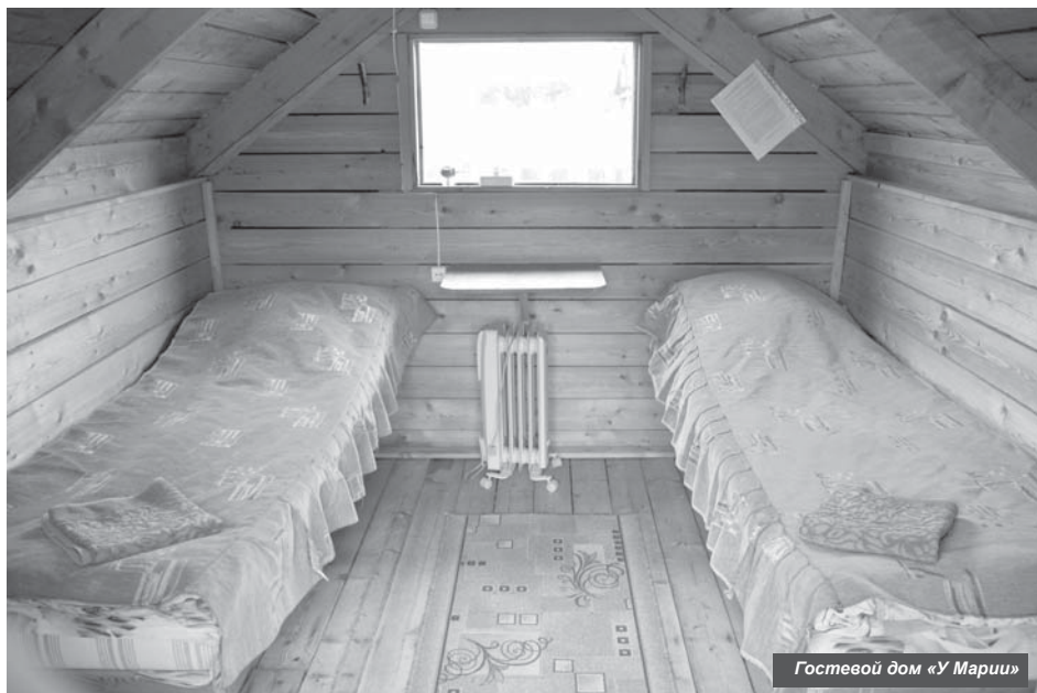
Гостевой дом «У Марии»