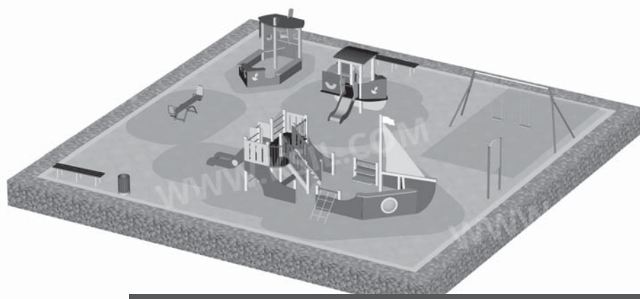
Эскиз будущей детской площадки во дворе домов №№ 9, 10 и 25 по ул. 60 лет Октября