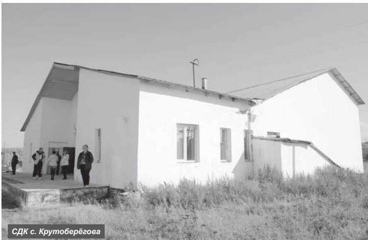
СДК с. Крутоберёгово