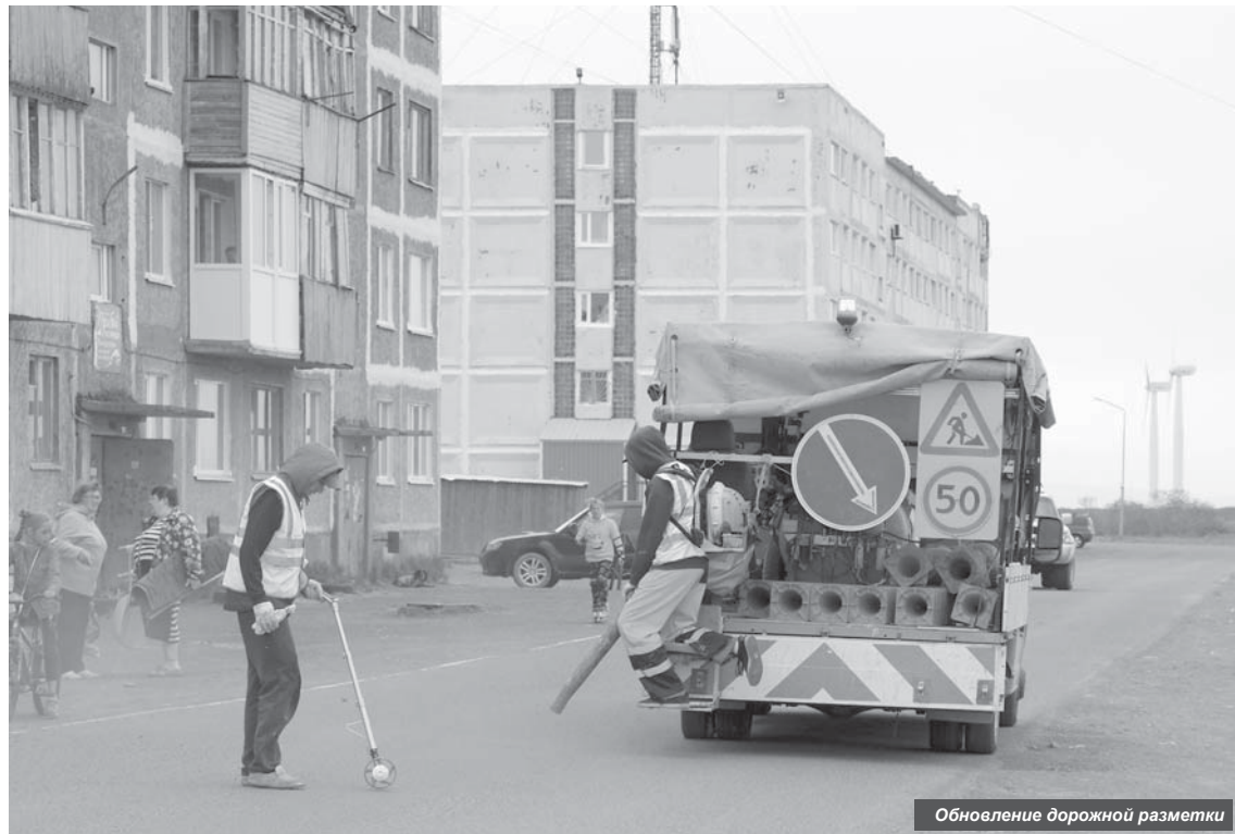
Обновление дорожной разметки