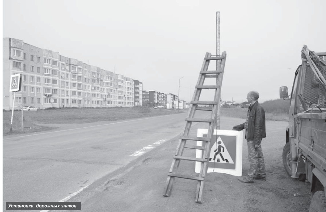
Установка дорожных знаков