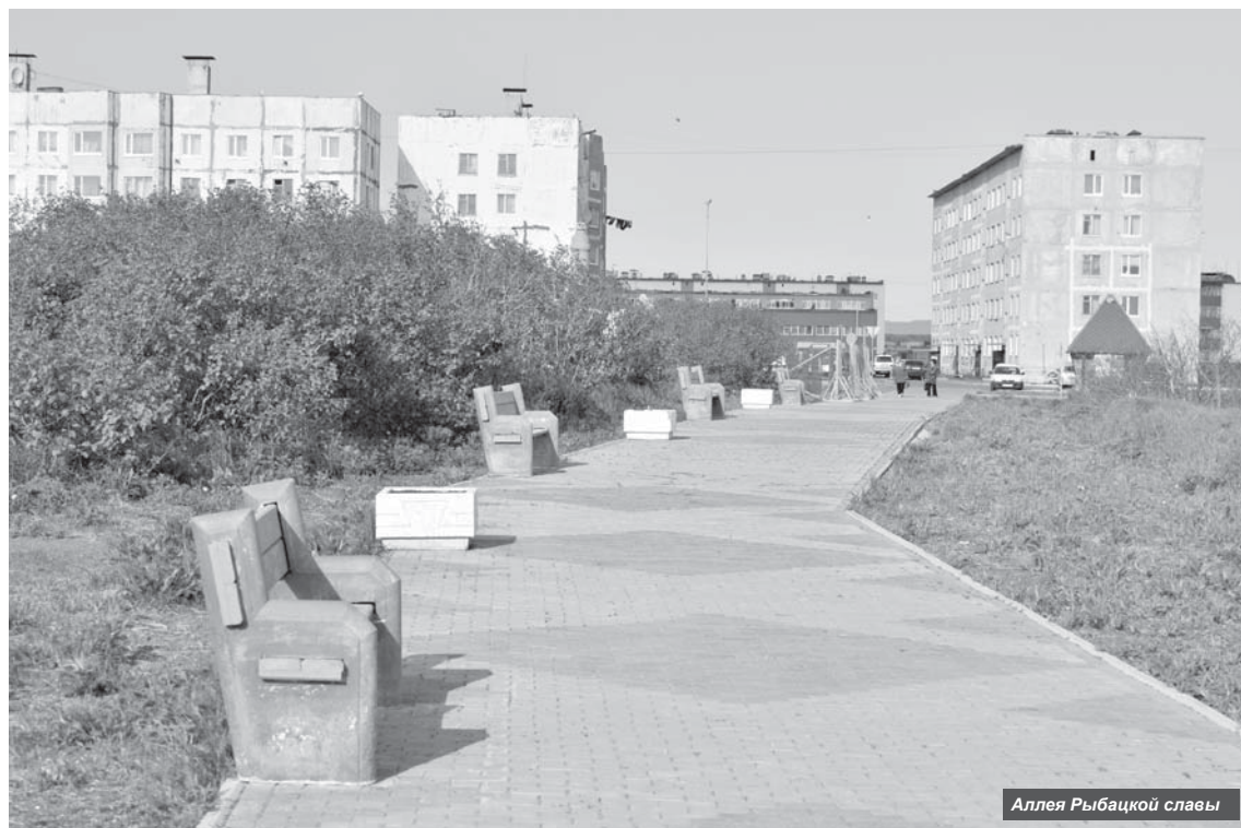
Аллея Рыбацкой славы

Во-вторых, хочу особенно отметить немалые трудности, связанные с техническим состоянием котельного оборудования. Сегодня необходимо