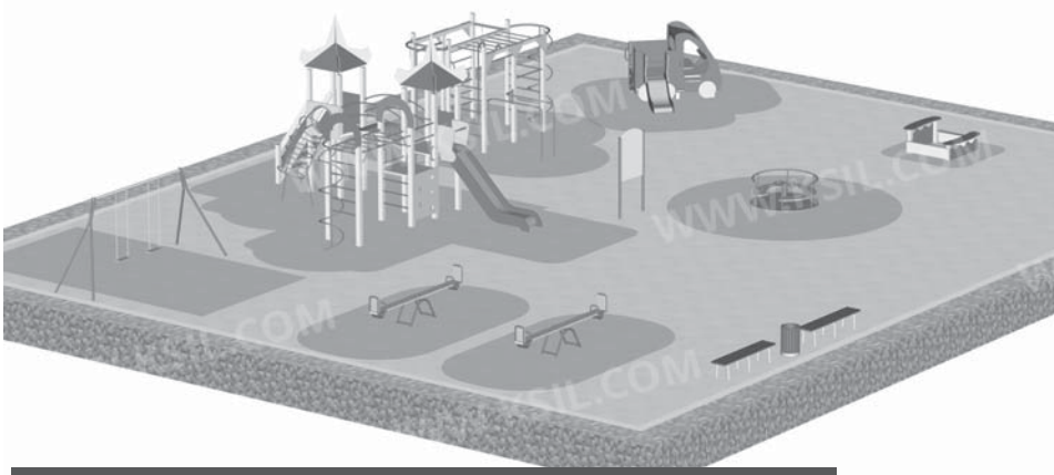
Эскиз будущей детской площадки во дворе домов №№ 6 и 7 по ул. 60 лет Октября