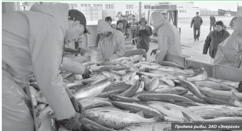
Приёмка рыбы, ЗАО «Энергия»

На Камчатке 1 июня стартовала главная рыбалка края – лососёвая. И началась она с восточного побережья, в частности, в Усть-Камчатске.