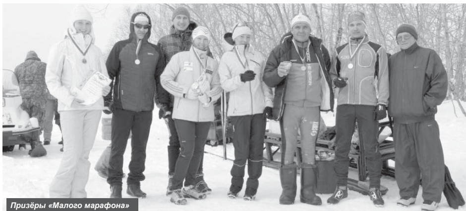
Призёры «Малого марафона»

8 апреля на «Лыжню здоровья» п. Ключи вышли сильнейшие спортсмены.