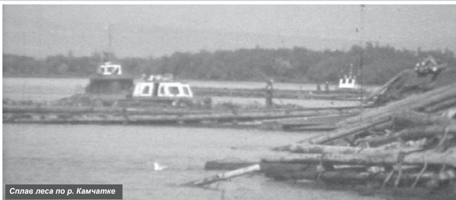
Сплава леса по р. Камчатке

С этими учреждениями архивом ведётся кропотливая работа по упорядочению, описанию документов и передаче их на хранение. Есть целый ряд ведомственных архивов, архивисты которых осознают важность и необходимости архивной работы, относятся ответственно и добросовестно к порученному делу, всегда качественно и в установленные сроки занимаются обработкой документов. Наиболее оперативно работают, внимательно относятся к рекомендациям архива специалисты отделов и управлений администрации Усть-Камчатского муниципального района и