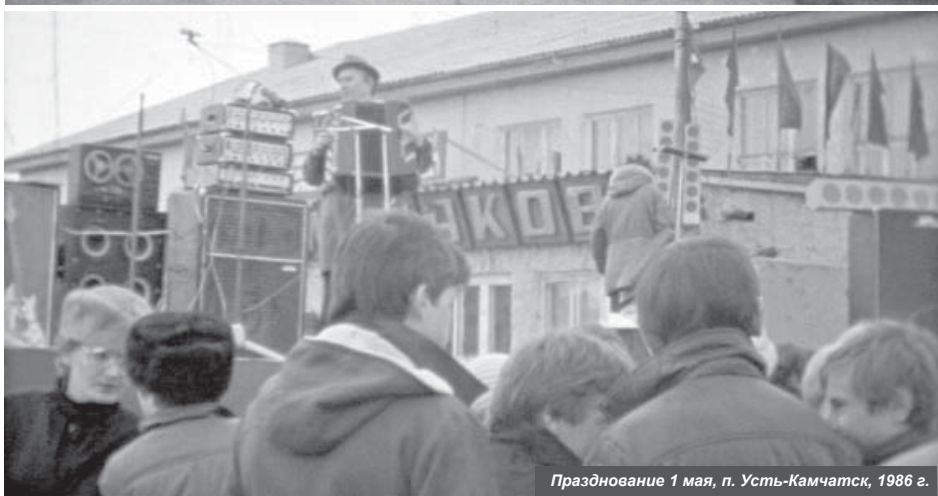
Празднование 1 мая, п. Усть-Камчатск, 1986 г.