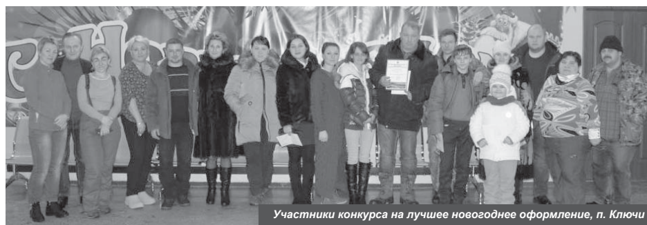
Участники конкурса на лучшее новогоднее оформление, п. Ключи