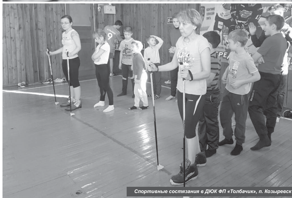
Спортивные состязания в ДЮК ФП «Толбачик», п. Козыревск