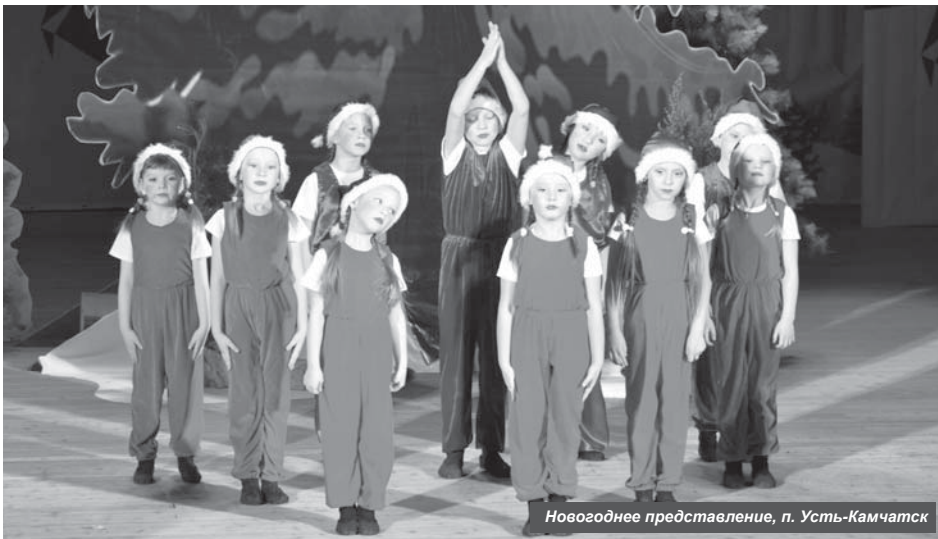
Новогоднее представление, п. Усть-Камчатск