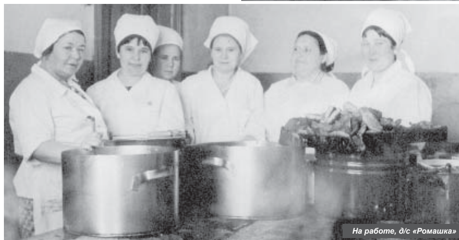
На работе, д/с «Ромашка»