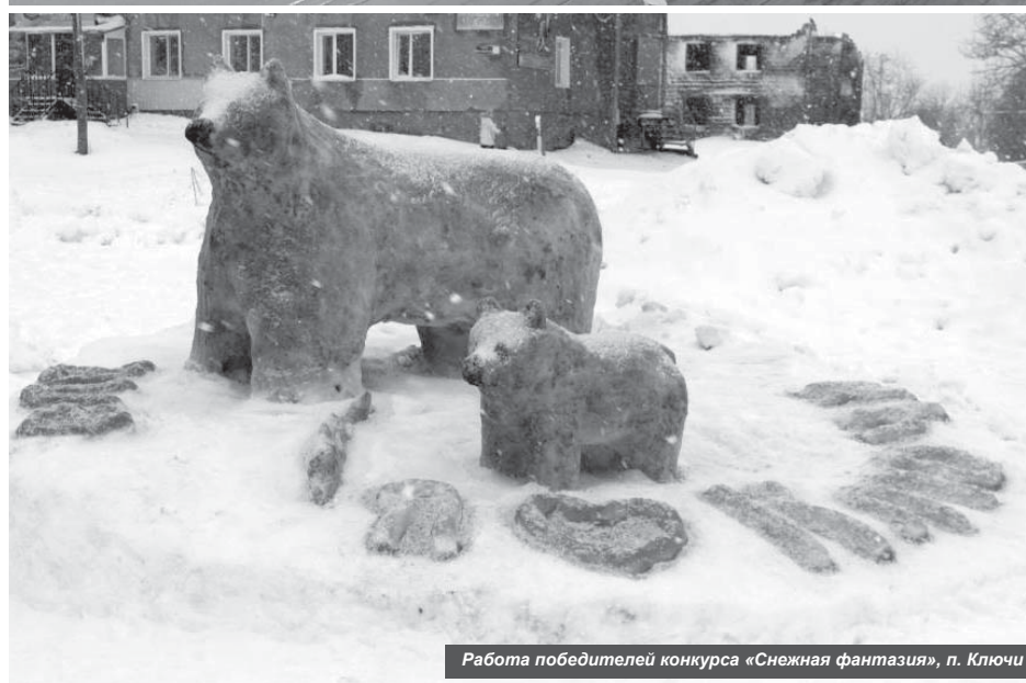
Работа победителей конкурса «Снежная фантазия», п. Ключи