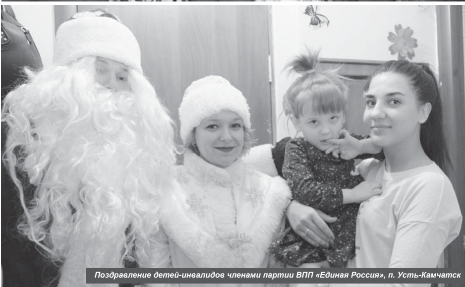
Поздравление детей-инвалидов членами партии ВПП «Единая Россия», п. Усть-Камчатск