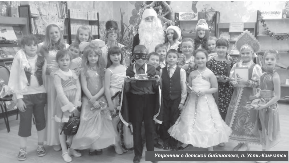
Утренник в детской библиотеке, п. Усть-Камчатск