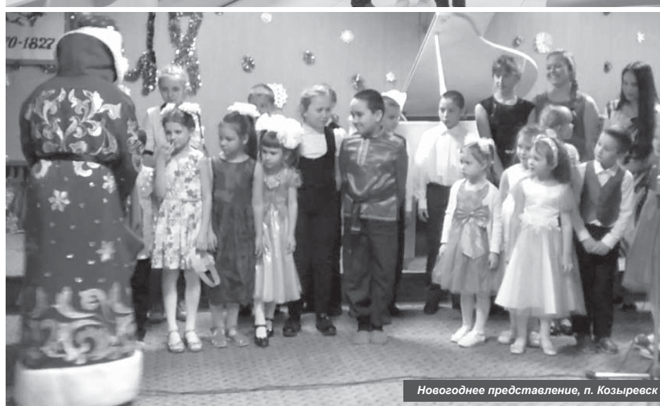
Новогоднее представление, п. Козыревск