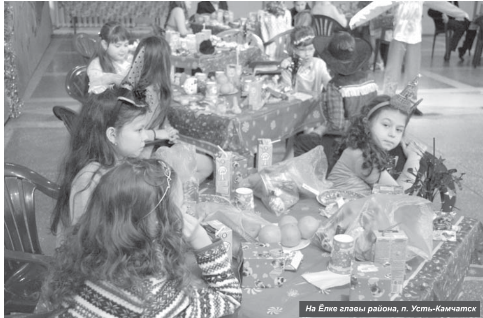
На Ёлке главы района, п. Усть-Камчатск