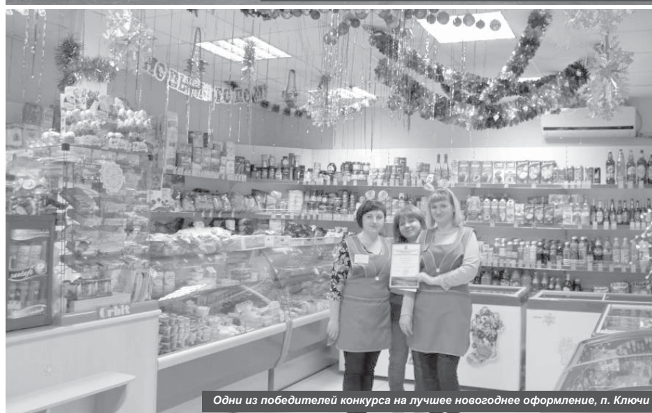
Одни из победителей конкурса на лучшее новогоднее оформление, п. Ключи