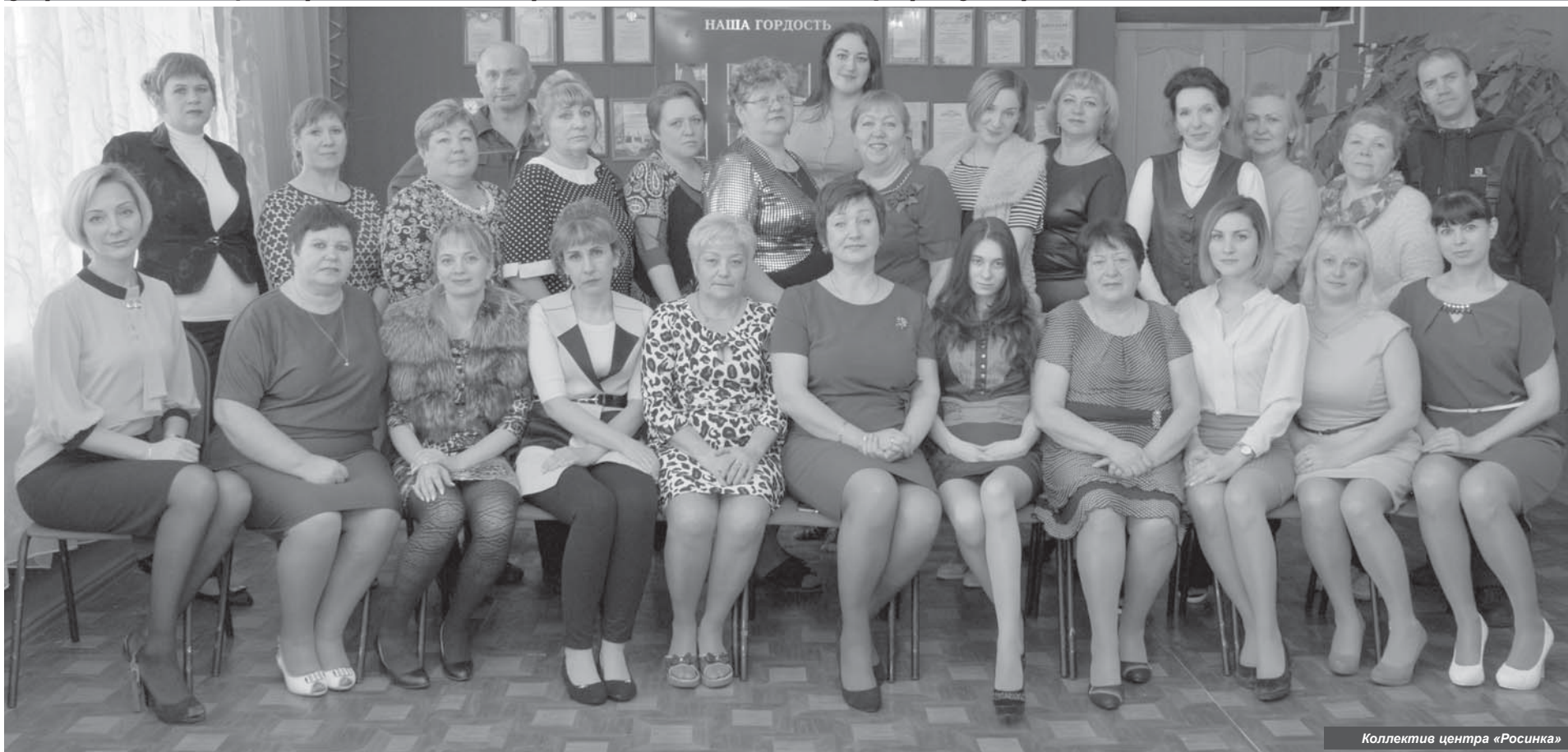
Коллектив центра «Росинка»

8 декабря исполняется 20 лет со дня образования краевого государственного бюджетного учреждения «Центр содействия развитию семейных форм устройства «Росинка».