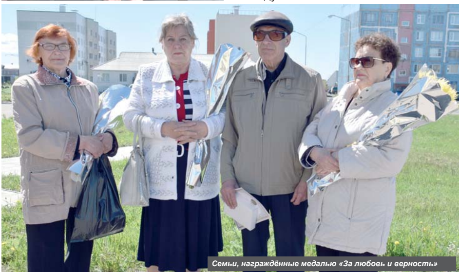
Семья, награждённая медалью «За любовь и верность»