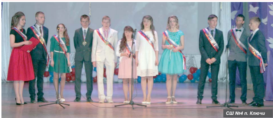
СШ №4 п. Ключи

Одиннадцать выпускников окончили Ключевскую среднюю школу № 4. Закончилось детство и для семи бывших учащихся средней школы № 5.