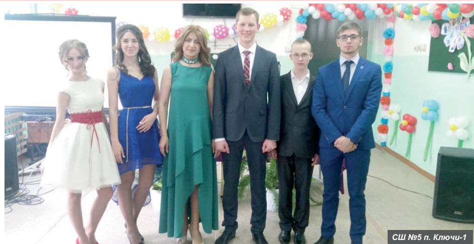
СШ №5 п. Ключи-1