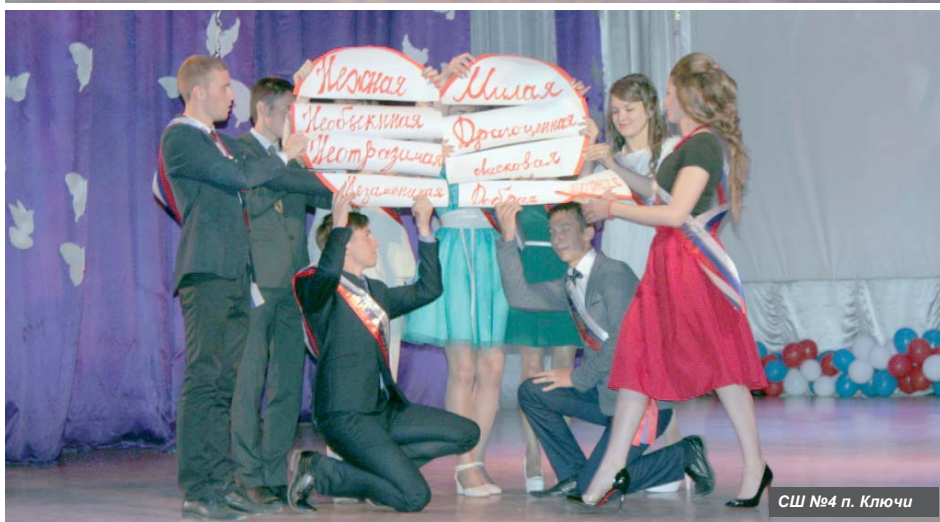
СШ №4 п. Ключи

Совсем недавно они были юными школьниками, а сегодня – это совсем уже взрослые ребята, которым предстоит долгий и насыщенный путь в новой жизни.