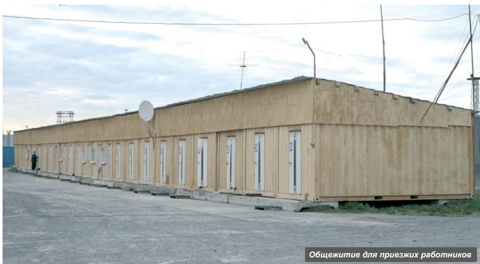
Общежитие для приезжих работников

Заведующая производством рассказала и о ходе лососёвой путины – 2017: «Первая половина июня очень порадовала богатыми уловами. Они точно побили результаты за последние пятнадцать лет: в течение 15 дней мы взяли 2000 тонн нерки. Для нас это довольно много. Однако эти две недели одновременно были и очень тяжёлыми в физическом плане. Сейчас рыба сбавила ход, но ждём кету, горбушу, кижуча. В целом, уже можно отметить хороший результат для нашего предприятия».