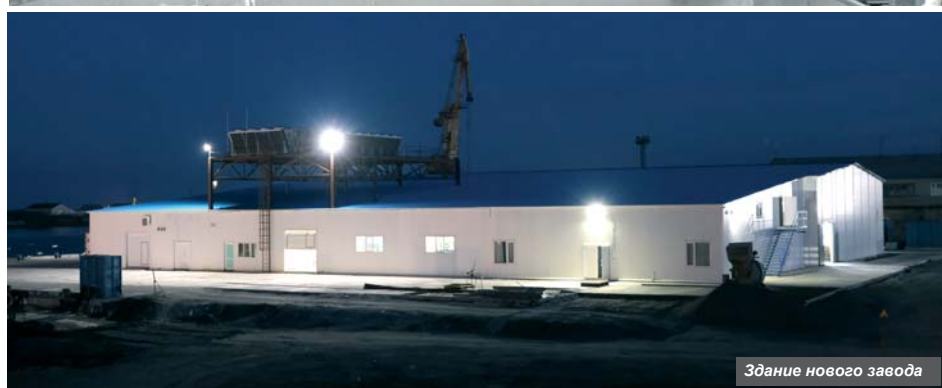
Здание нового завода