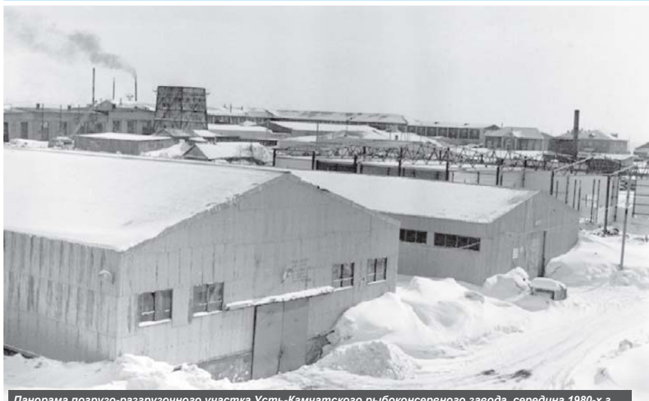
Панорама погрузо-разгрузочного участка Усть-Камчатского рыбконсервного завода, середина 1980-х г.

Два десятилетия назад в районном центре было образовано ООО «Устькамчатрыба». Сейчас это самое крупное рыбодобывающее и рыбоперерабатывающее предприятие Усть-Камчатского района. Однако путь к процветанию был нелёгким и занял не один год... О том, как всё начиналось рассказали старейшие работники «Устькамчатрыбы», жизни которых вот уже 20 лет неразрывно связаны с этим предприятием.