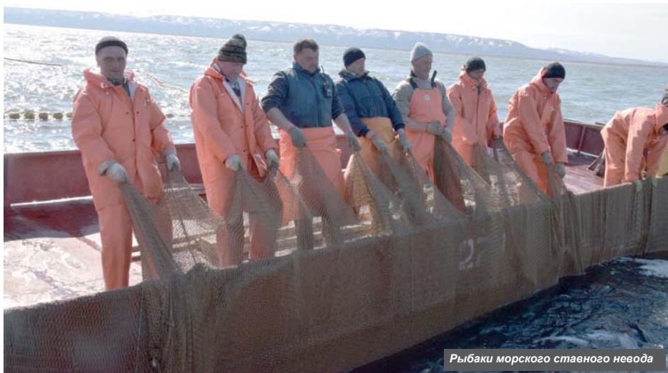
Рыбаки морского ставного невода