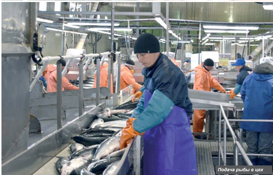
Подача рыбы в цех