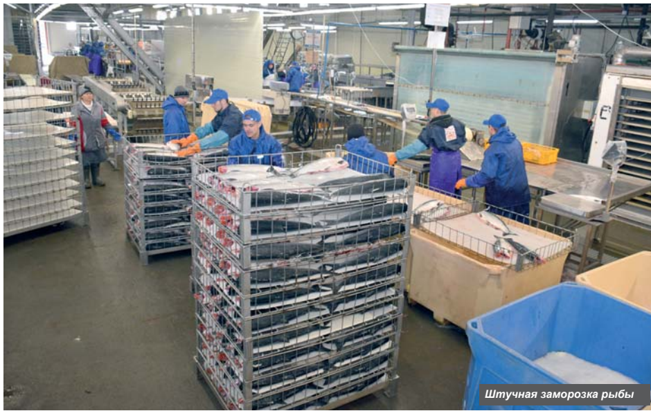
Штучная заморозка рыбы