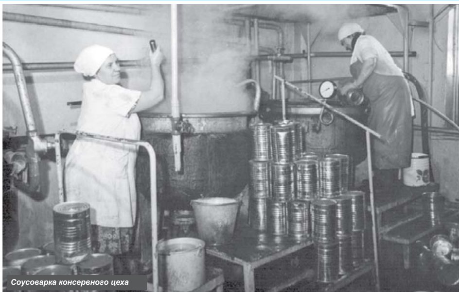
Соусоварка консервного цеха