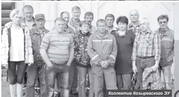
Коллектив Козыревского ЭУ