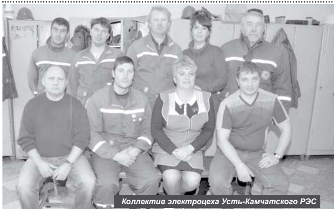
Коллектив электроцеха Усть-Камчатского РЭС

Юлия Молчанова, при использовании информации пресслужбы ОАО «ЮЭСК»