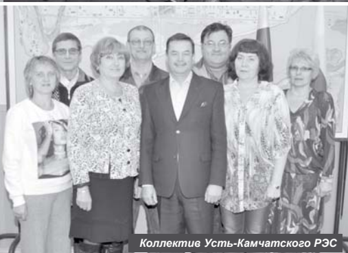
Коллектив Усть-Камчатского РЭС