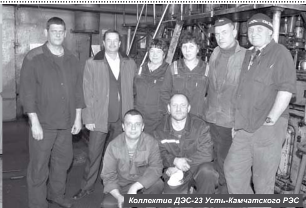
Коллектив ДЭС-23 Усть-Камчатского РЭС