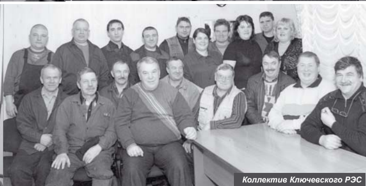
Коллектив Ключевского РЭС