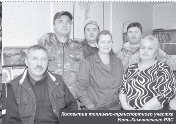
Коллектив топливно-транспортного участка Усть-Камчатского РЭС