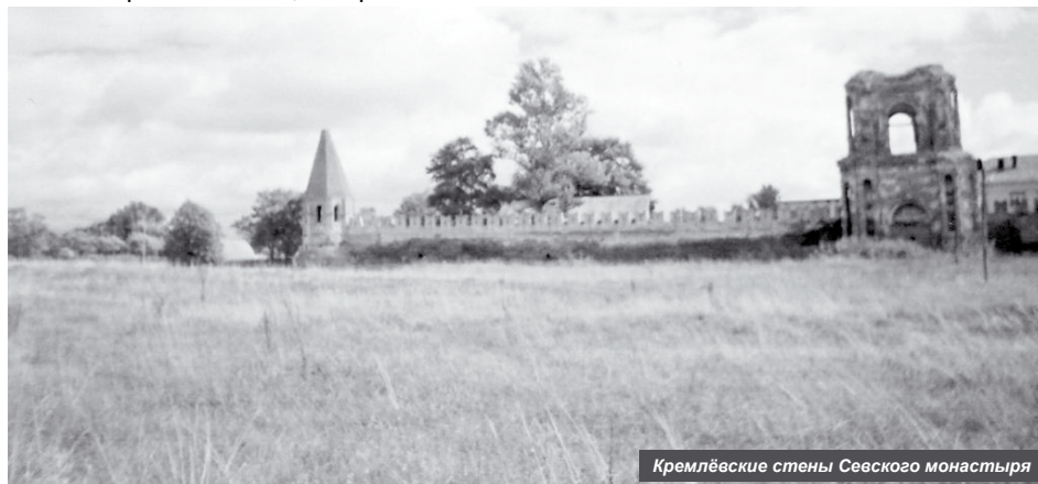
Кремлёвские стены Севского монастыря