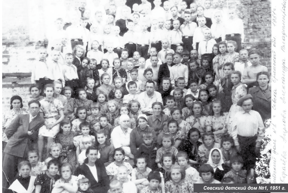
Севский детский дом №1, 1951 г.