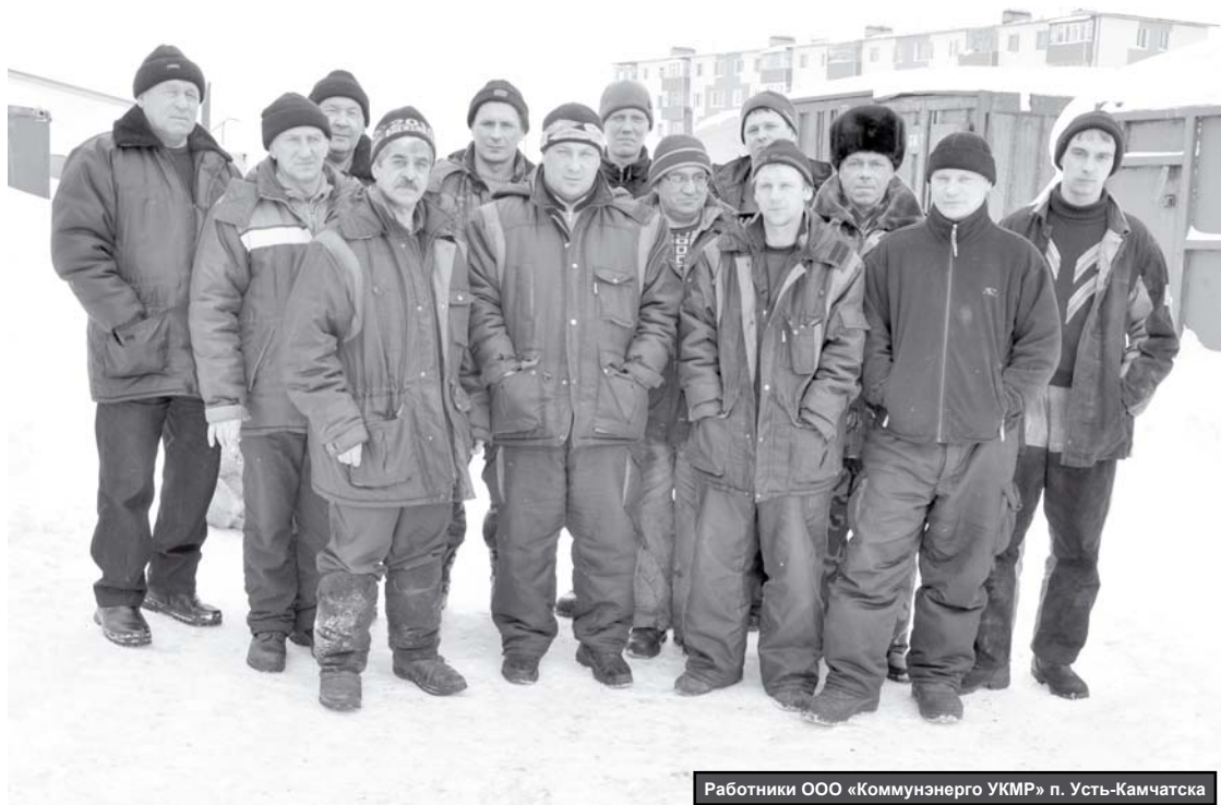
Работники ООО «Коммунэнерго УКМР» п. Усть-Камчатска