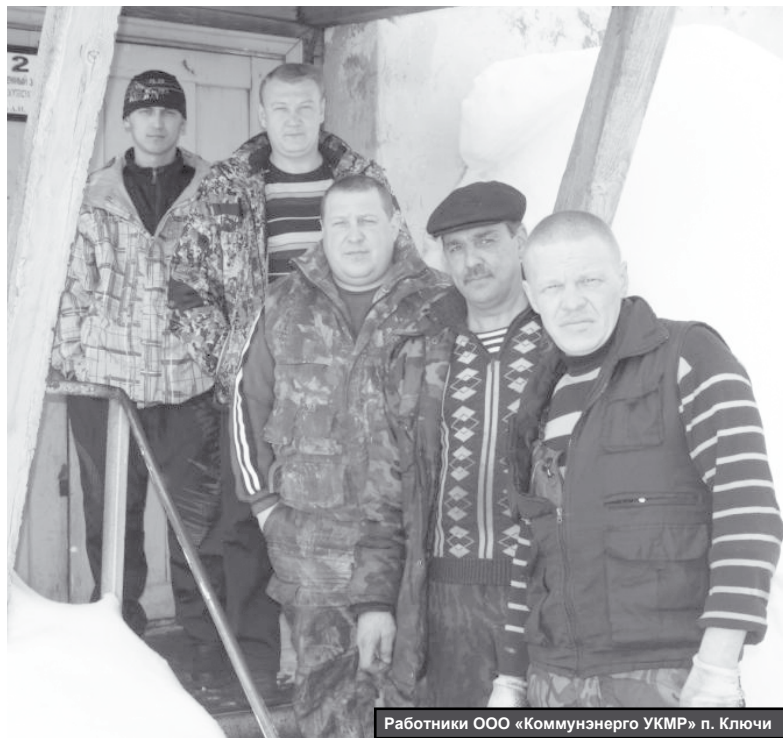
Работники ООО «Коммунэнерго УКМР» п. Ключи