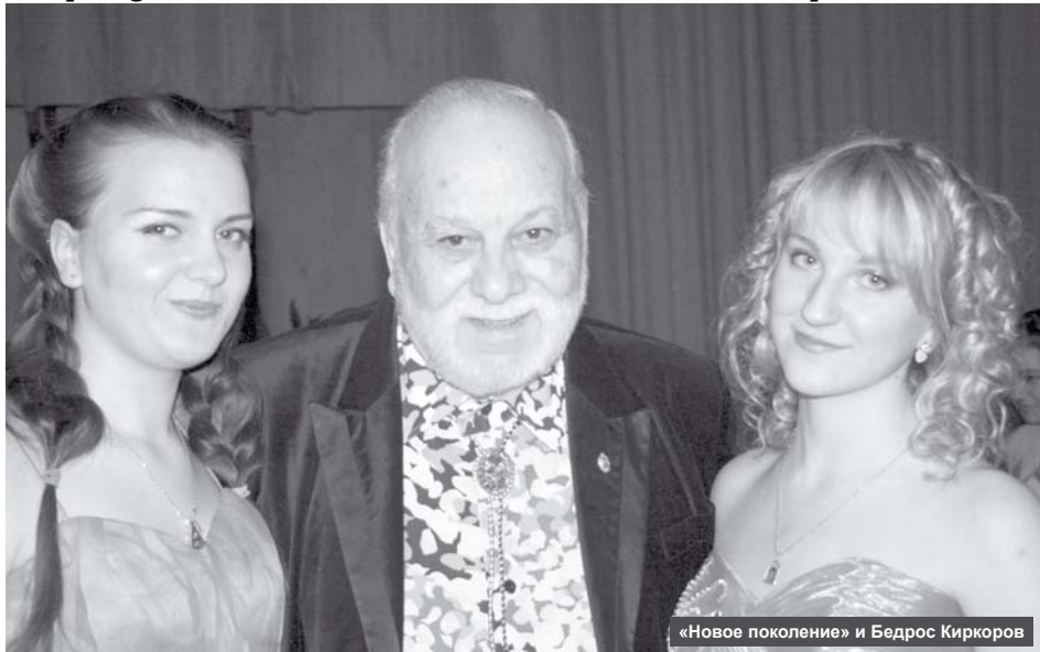
«Новое поколение» и Бедрос Киркоров

Воспитанницы вокально-эстрадного объединения «Новое поколение» вернулись из Великого Новгорода с заслуженными наградами.