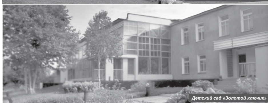
Детский сад «Золотой ключик»