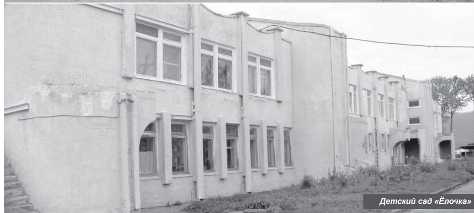
Детский сад «Ёлочка»