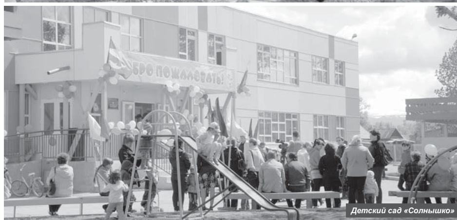
Детский сад «Солнышко»