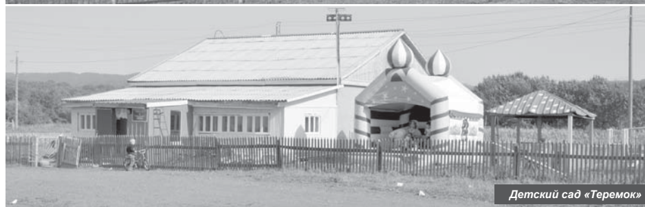
Детский сад «Теремок»