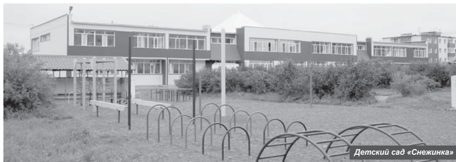
Детский сад «Снежинка»