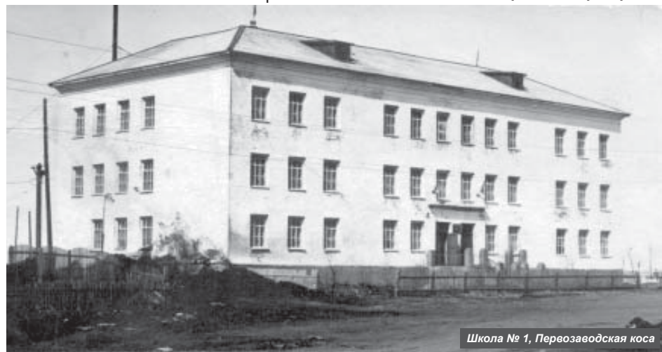
Школа № 1, Первозаводская коса

Использована информация с сайта: http://www.km.ru , Автор – Виктор Борисов