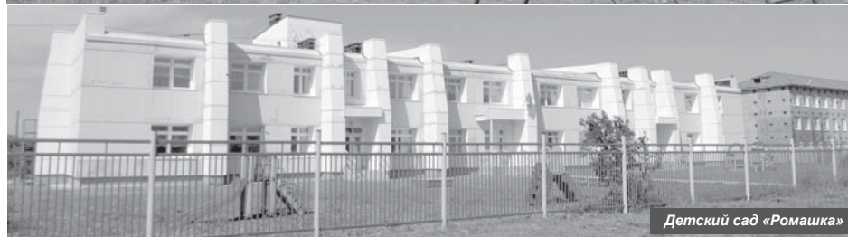
Детский сад «Ромашка»