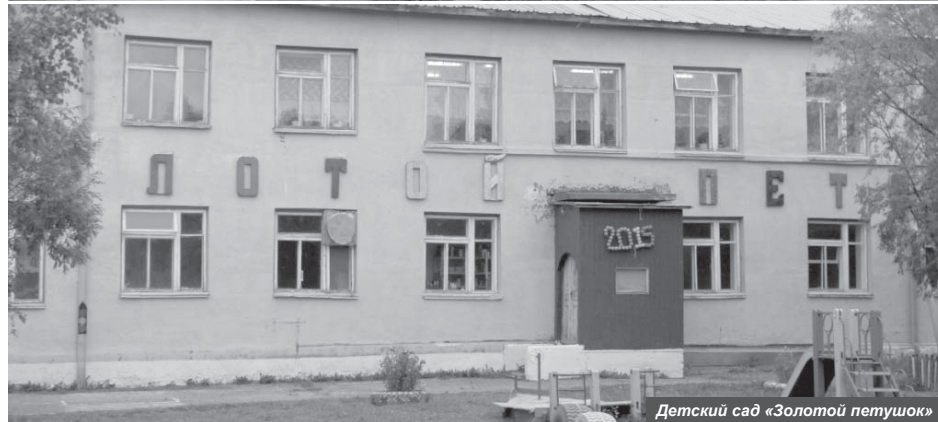
Детский сад «Золотой петушок»