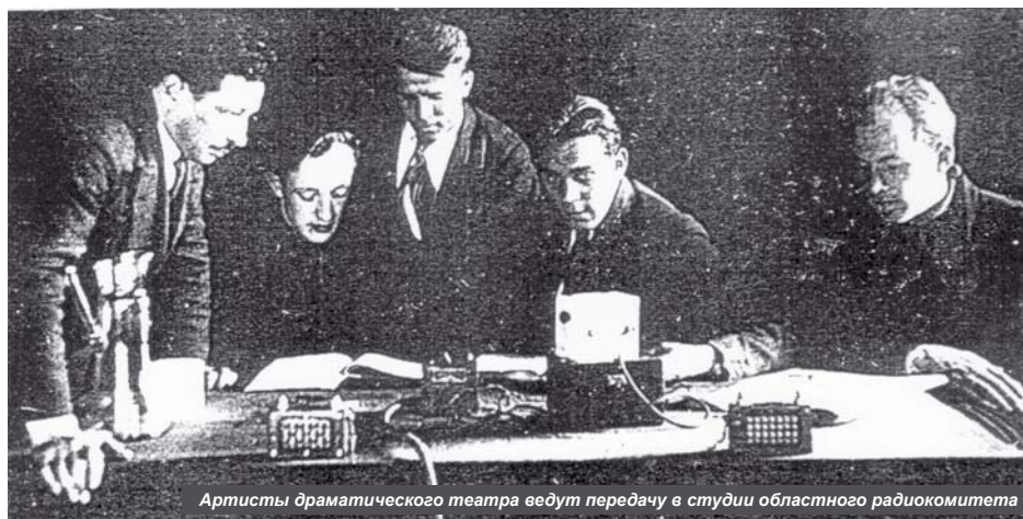
Артисты драматического театра ведут передачу в студии областного радиокомитета