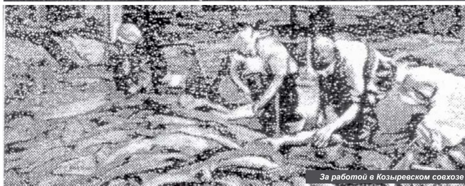
За работой в Козыревском совхозе