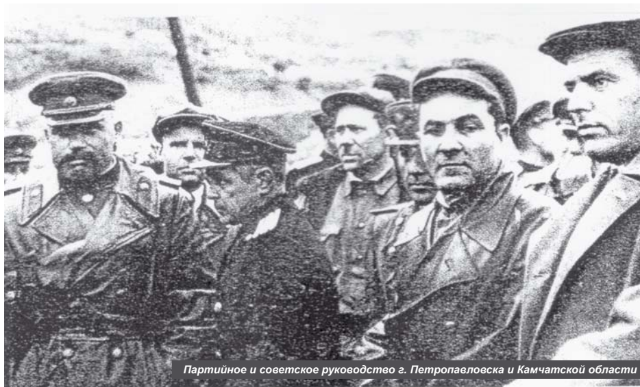
Партийное и советское руководство г. Петропавловска и Камчатской области