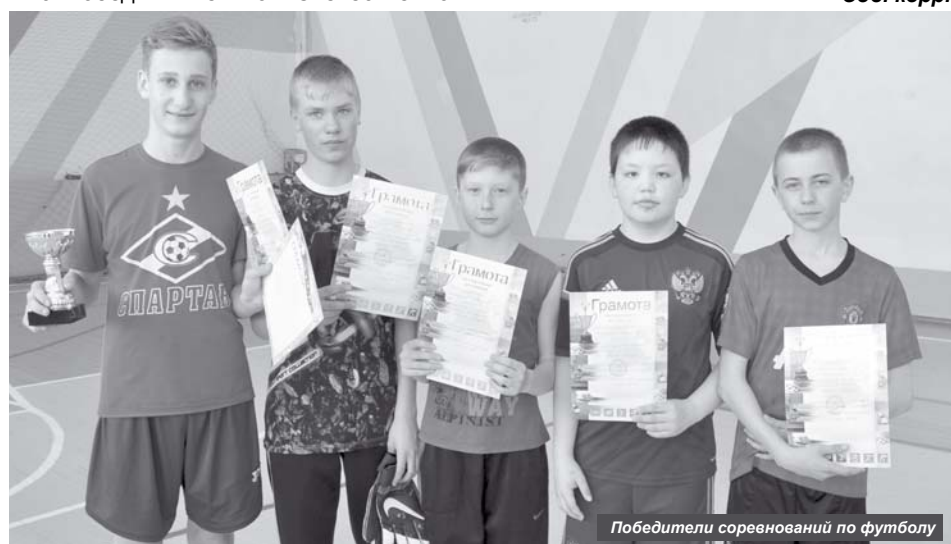
Победители соревнований по футболу

По результатам соревнований первое место и главный приз – кубок спортшколы, завоевала команда «Спартак», вторыми стали игроки «Динамо», «Реал» расположился на третьей строчке турнирной таблицы, а самые маленькие футболисты из «Зенита» стали четвёртыми. В ходе длительных соревнований