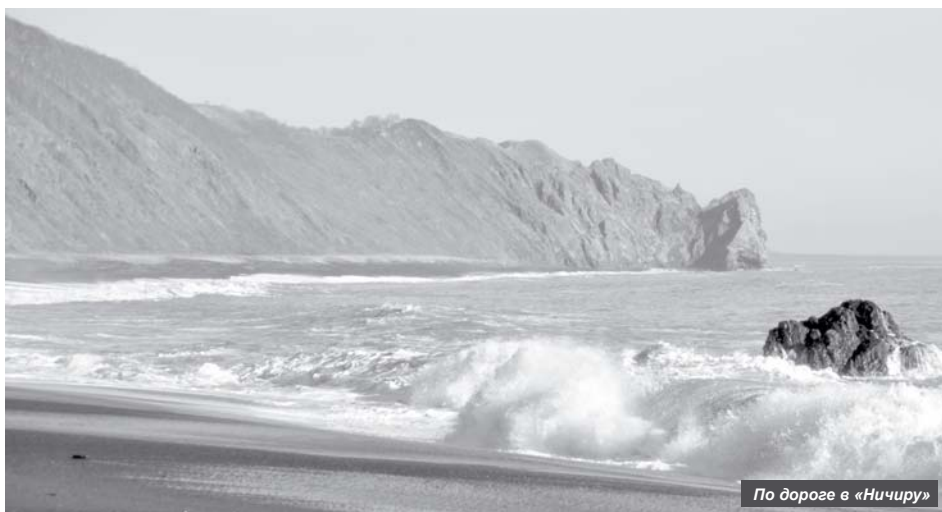
По дороге в «Ничиру»

Усть-Камчатск и туризм – на первый взгляд, две несовместимые вещи. В поселении нет всей необходимой для данной деятельности инфраструктуры, мало мест, которые можно посетить... Но это лишь на первый, далеко не внимательный взгляд.