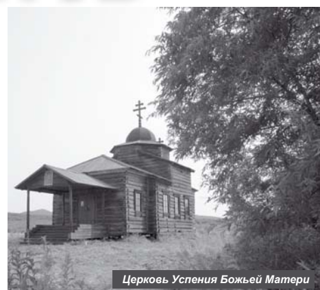
Церковь Успения Божьей Матери

Первая, и, пожалуй, самая главная достопримечательность Усть-Камчатска, которую непременно стоит посетить – церковь Успения Пресвятой Богороди-