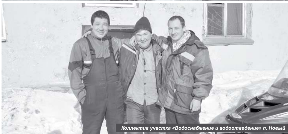
Коллектив участка «Водоснабжение и водоотведение» п. Новый

В одном из прошлых выпусков нашей газеты мы уже рассказывали о нелёгком труде водителей снегоуборочной техники. На этот раз наш материал о работе коллектива другого не менее важного для нашей благополучной жизни участка – «Водоснабжение и водоотведение» ООО «Коммунаэнерго УКМР».