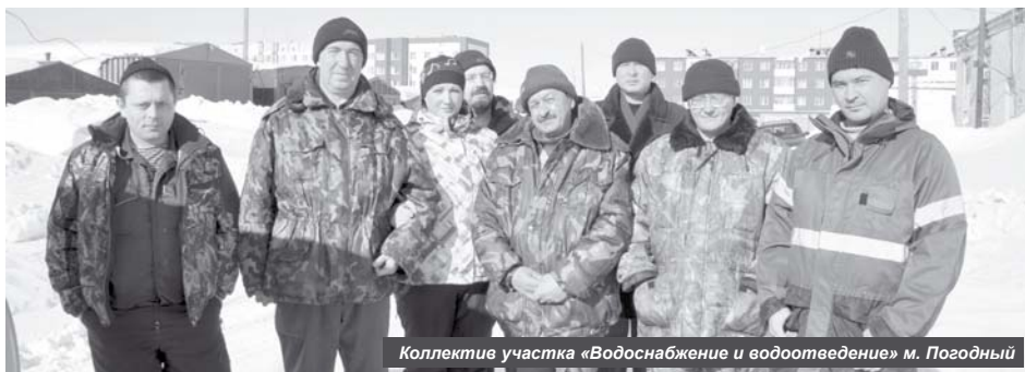
Коллектив участка «Водоснабжение и водоотведение» м. Погодный

15 марта работники жилищно-коммунального хозяйства отметят свой профессиональный праздник.