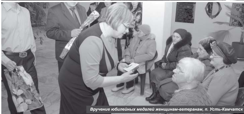
Вручение юбилейных медалей женщинам-ветеранам, п. Усть-Камчатск