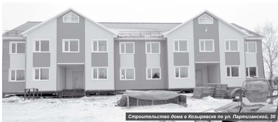
Строительство дома в Козыревске по ул. Партизанской, 30