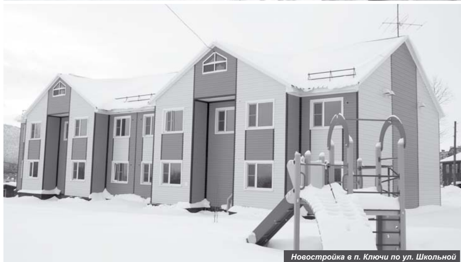
Новостройка в п. Ключи по ул. Школьной