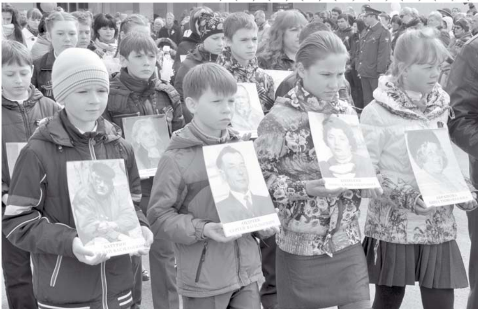
«БЕССМЕРТНЫЙ ПОЛК» ОНИ ДОЛЖНЫ ИДТИ ПОБЕДНЫМ СТРОЕМ В ЛЮБЫЕ ВРЕМЕНА