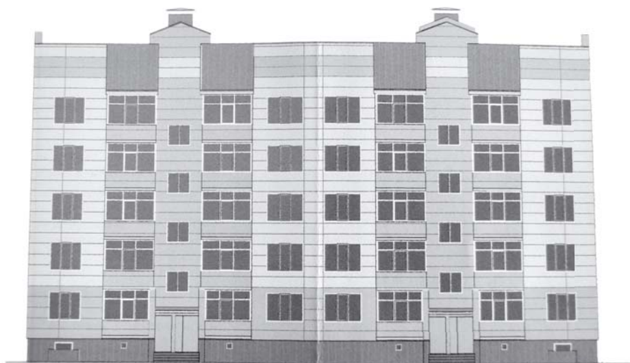
Проект будущей блок-секции на месте дома № 4 по ул. 60 лет Октября, Усть-Камчатск

К концу 2015 года отдельные жители Усть-Камчатского района справят новоселье