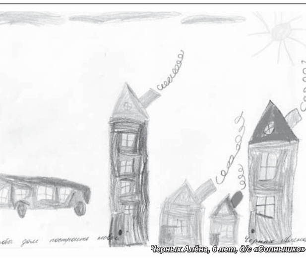
Черных Алёна, 6 лет, д/с «Солнышко»