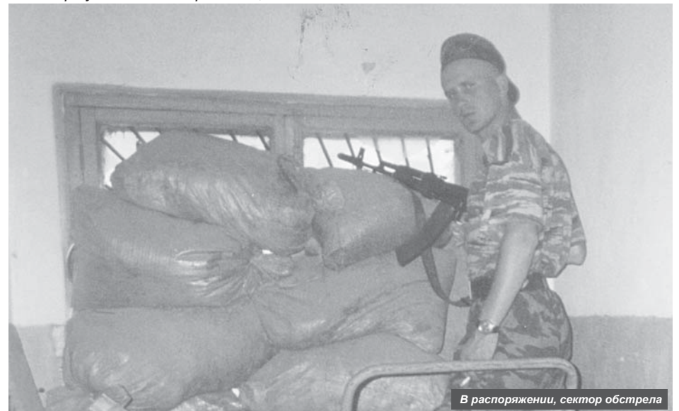
В распоряжении, сектор обстрела