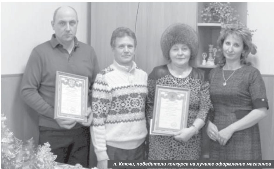
п. Ключи, победители конкурса на лучшее оформление магазинов