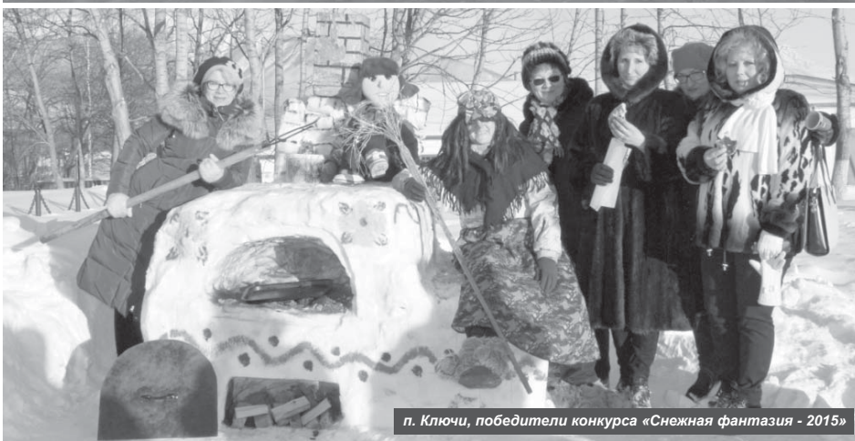
п. Ключи, победители конкурса «Снежная фантазия - 2015»