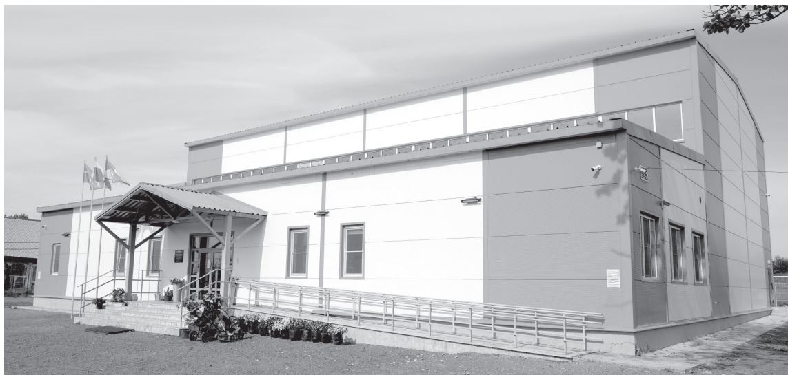
Новый спортзал в посёлке Козыревске