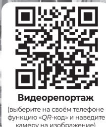
Видеорепортаж (выберите на своём телефоне функцию «QR-код» и наведите камеру на изображение)