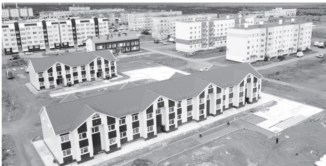
Новостройки в посёлке Усть-Камчатске