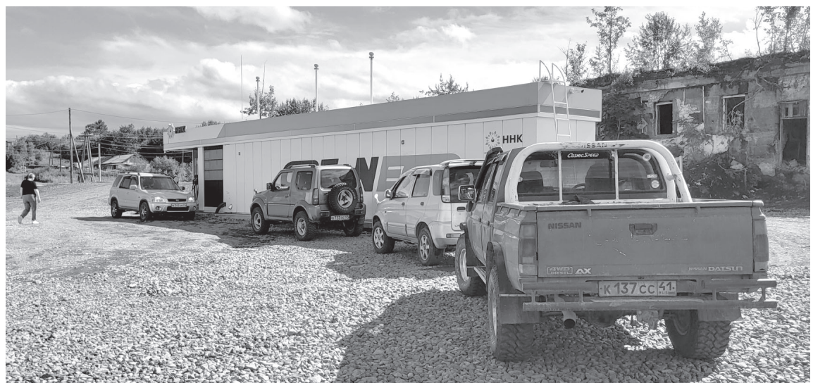
Новая АЗС в посёлке Ключи