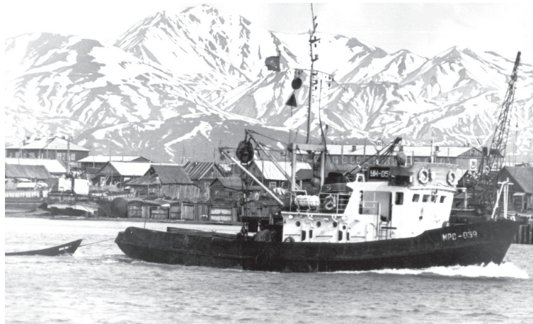
📍 Выход на промысел MPC-039

К концу XIX века через устье Камчатки наладили регулярные морские рейсы до Владиво-