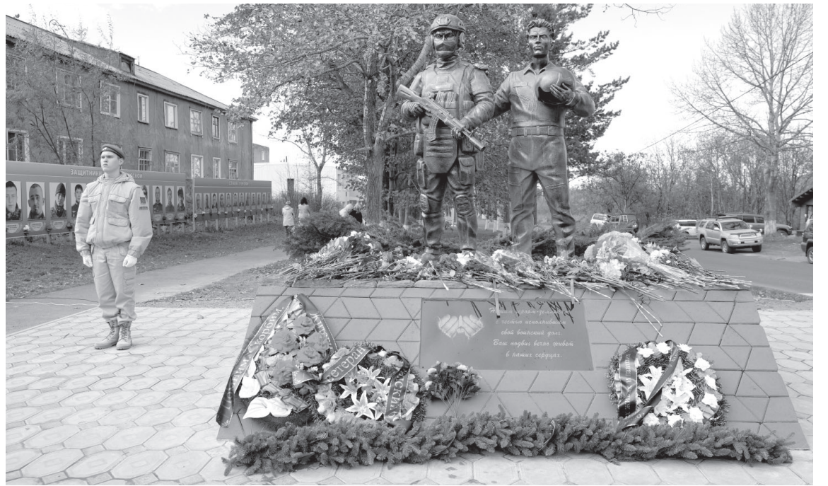
Памятник участникам СВО в посёлке Ключи

Впереди — реализация плана до 2030 года, новые проекты, новые поколения, которые продолжат писать историю этой уникальной территории.