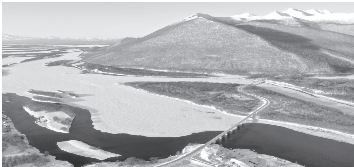
Мостовые сооружения в посёлке Ключи

2013 год — исторический прорыв. Впервые за несколько