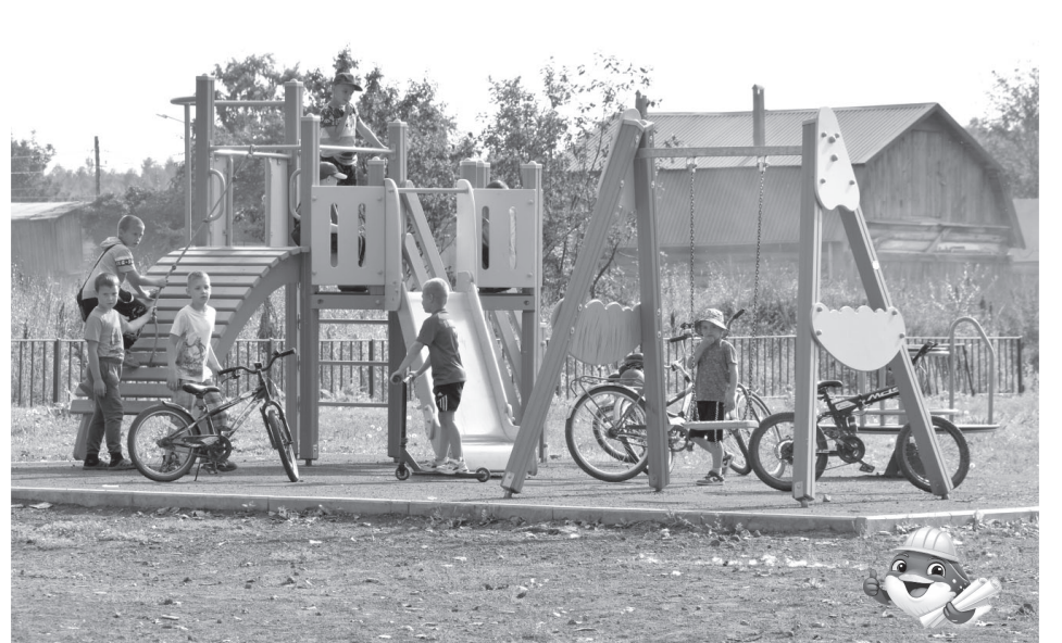
Детская игровая площадка в посёлке Козыревске