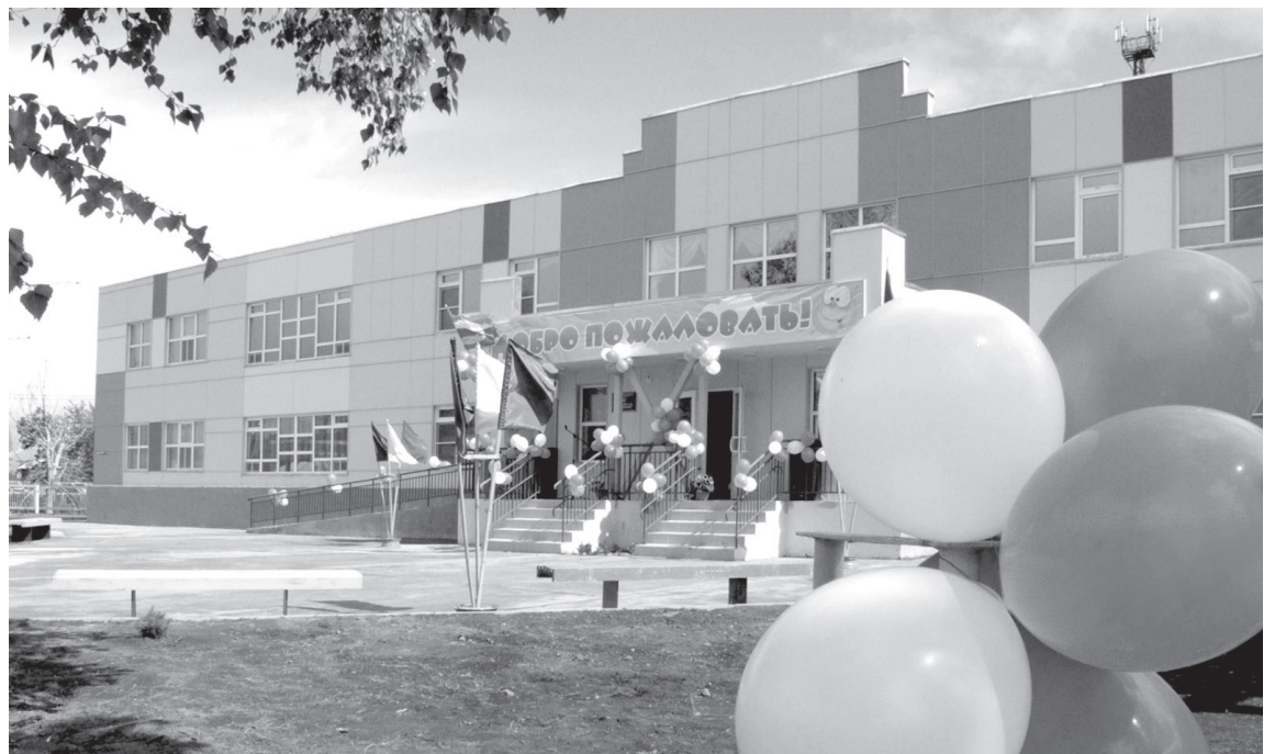
Детский сад «Солнышко» в посёлке Козыревске