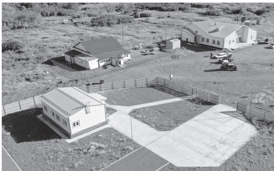
Фельдшерский здравпункт в селе Крутоберёгове