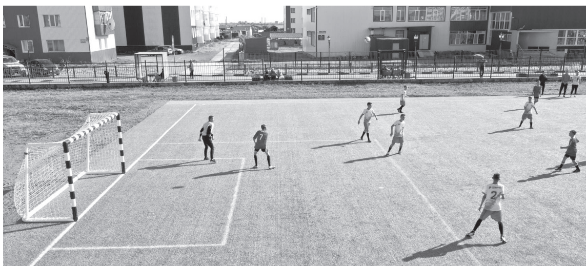
Футбольное поле в посёлке Усть-Камчатске