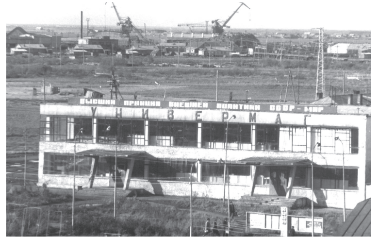
📍 Недавно построенный универмаг в Посёлке Новом

В 1935 году открылась первая на Камчатке научно-ис-