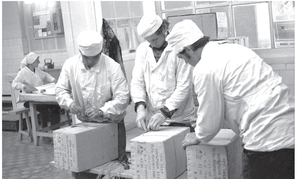
Усть-Камчатский рыбокомбинат № 65. 1972 год.

— Люди у нас работают хорошие. Есть молодые и пожилые, есть весёлые и неразговорчивые, есть такие, у кого дома всё хорошо, а у других — одни трещины и разлад, а по работе выделить кого-то не могу и не хочу. Нет в нашем цехе прогулов и нарушений дисциплины, нет ленивых и вздорных. Премию делю на всех поровну, хотя слышала, что это