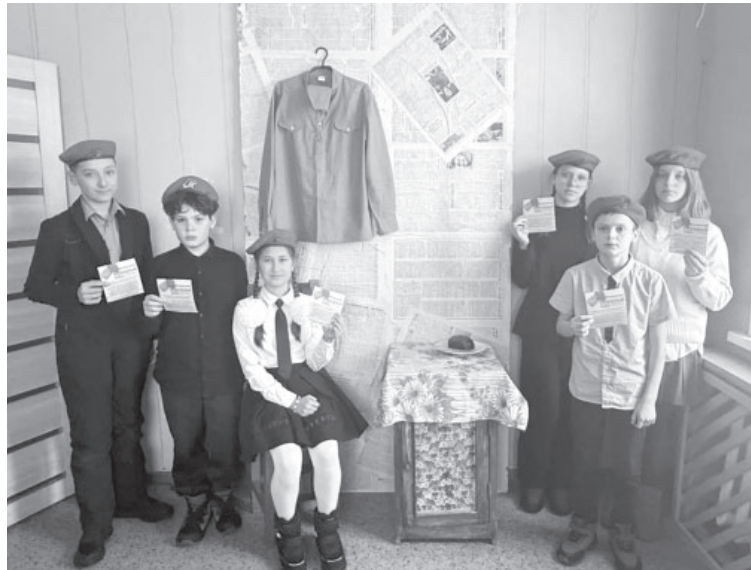
📷 Акция «Блокадный хлеб» в посёлке Козыревске

В минувшие дни жители округа, особенно школьники, стали участниками трогательных событий, посвящённых 82-й годовщине освобождения Ленинграда от фашистской блокады. Эхо тех страшных дней прозвучало в стенах культурных учреждений.