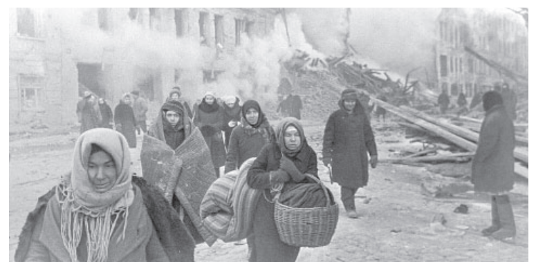
📷 В блокадном Ленинграде. 1941-1944 гг.

Итог сталинградской кампании — разгром 6-й армии и других соединений противника; суммарные потери врага оценивают примерно в 1,5 миллиона человек. За подвиг 44 соединения получили почётные наименования, 55 частей были награждены орденами, 183 соединения преобразованы в гвардейские; сотни тысяч бойцов отмечены наградами, 112 стали Героями Советского Союза. 22 декабря 1942 года учреждена медаль «За оборону Сталинграда», которой было награждено более 700 тысяч участников