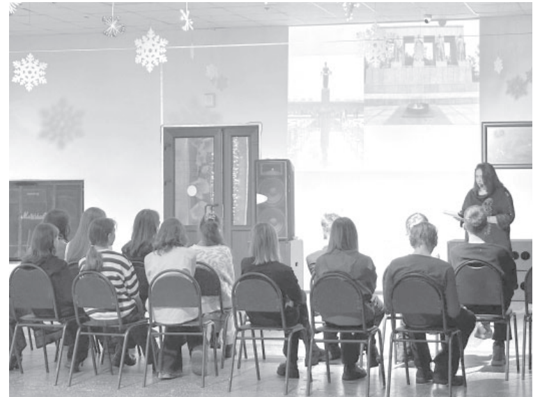
📷 Урок памяти в посёлке Усть-Камчатске

Так, в посёлке Козыревске в ПДЦ «Ракета» состоялся показ фильма «Африка». Картина рассказала зрителям не просто о лишениях, а о силе человеческого духа, о материнской любви и сострадании, которые помогли выжить в ледяном аду. Символом жестокой реальности стала акция «Блокадный хлеб», прошедшая там же. Участники не только услышали о 125-грам-