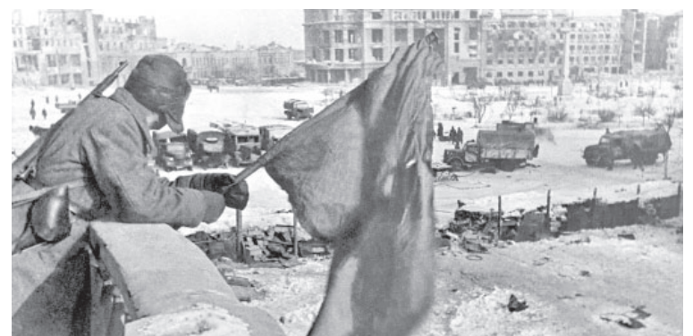
📷 Сталинградская битва 1942 г.

битвы. Позднее Сталинград получил почётные государственные знаки — признание величия подвига и стратегического значения победы.