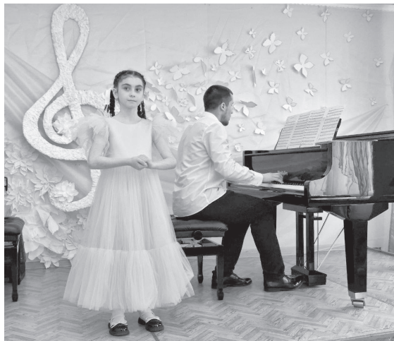
незабываемые впечатления. Спасибо педагогам и воспитанникам за прекрасный вечер!» - отметили зрители.

«После таких концертов понимаешь, насколько важно развивать творческие способности у детей и поддерживать их стремление к искусству. Отчётный концерт нашей школы искусств оставил самые