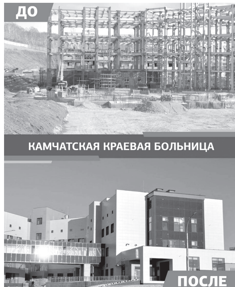
КАМЧАТСКАЯ КРАЕВАЯ БОЛЬНИЦА