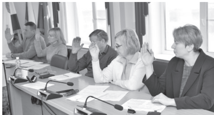
5-я сессия Совета народных депутатов УКМО