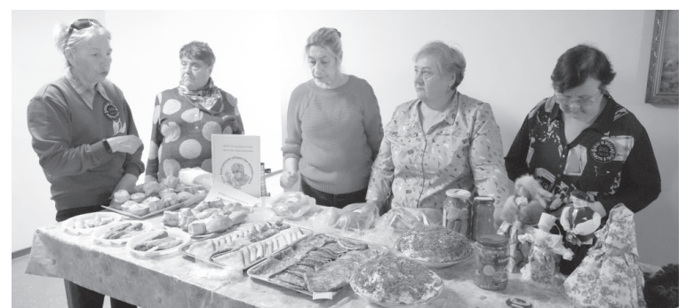
Благотворительная ярмарка в поддержку участников СВО