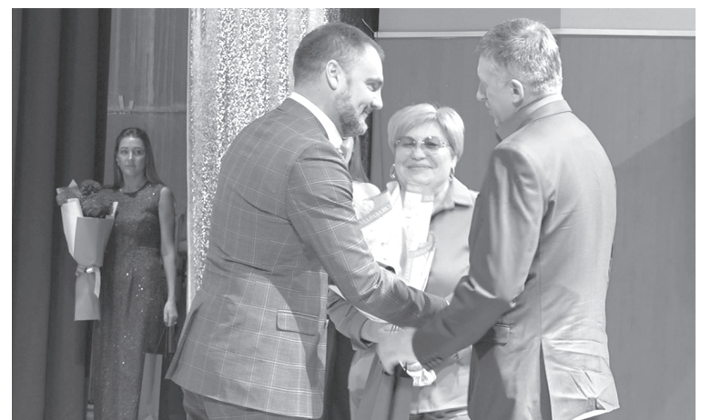
Глава района поздравляет семью-юбилера