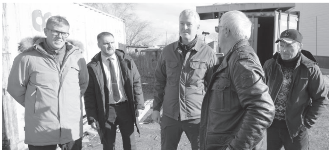
Представитель подрядчика докладывает главе региона В. Солодову о ходе возведения жилого дома в п. Ключи

Сейчас на федеральном уровне готовится к утверждению новая стратегия территориального пространственного развития Российской Федерации. В ней выделяются опорные населённые пункты страны, на которые будут сосредоточены меры поддержки федерального уровня. Посёлок Ключи Усть-Камчатского муниципального округа входит в их число. Особое внимание будет уделено развитию инфраструк-