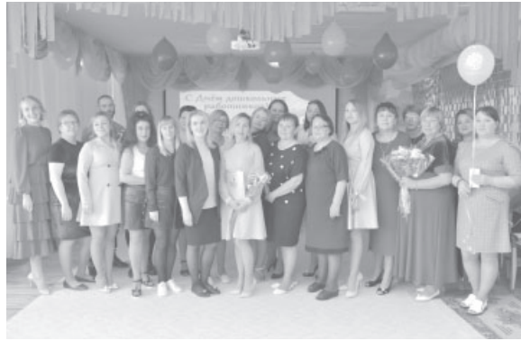
Коллектив МБДОУ № 6 детского сада «Снежинка»

Изначально в России дошкольное образование развивалось медленно. Дворяне считали, что и сами справляются с детьми. А у бедных попросту не было денег водить малышей в спецучреждения. И только после революции 1917 года детские сады стали более распространены — благодаря государственному финансированию. В учреждения принимали детей в возрасте от 3 до 5 лет. Преподавали шитье, развитие речи и моторики и общие дисциплины для развития.