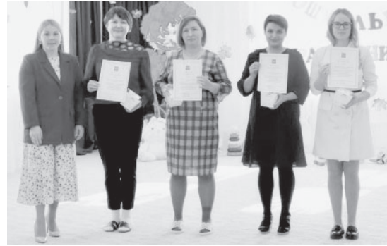
Специалисты дошкольного отделения МБОУ СШ № 6 п. Козыревска

Традиционно в учреждениях дошкольного образования Усть-Камчатского округа в этом году пройдут торжественные мероприятия с поздравлением виновников торжества и вручением наград различного уровня.