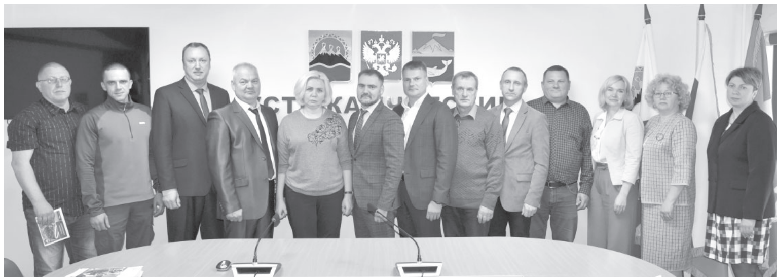
■ Депутаты Совета депутатов Усть-Камчатского муниципального округа Камчатского края 1-го созыва

Округ. 24 сентября в Усть-Камчатске состоялась первая сессия окружных депутатов.