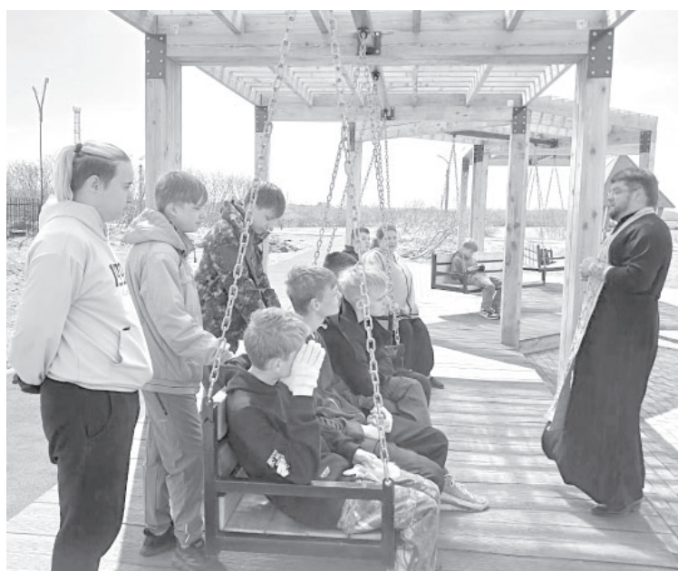
■ Беседа на тему очищения в п. Усть-Камчатске