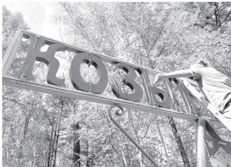
■ Покраска стелы на въезде в п. Козыревск

Приглашаем всех желающих присоединиться к уборке территорий!