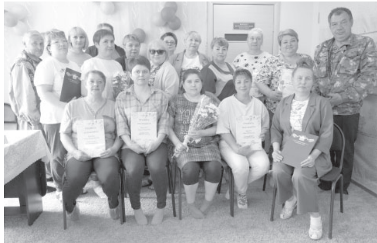
❶ После награждения ко Дню социального работника

Везде имеются комнаты психологической разгрузки. В число посетителей кабинета психолога в последнее время вошли члены участников СВО. К слову, на базе соццентра созданы пункты филиала фонда «Защитники Отечества», которые помогают ветеранам боевых