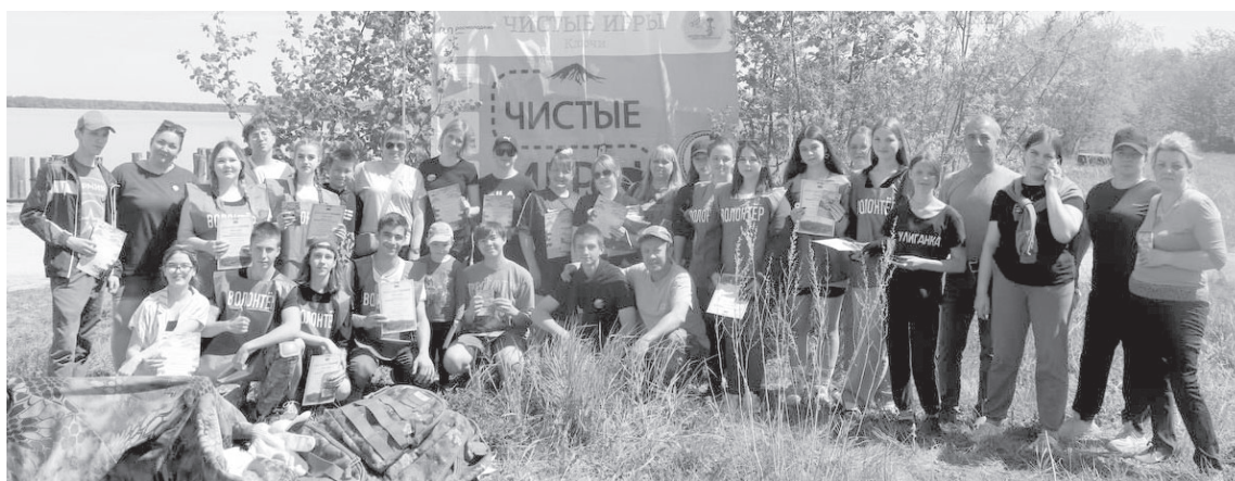
■ «Чистые игры» в п. Ключи

После квеста все участники проверили свои знания в области экологии в викторине, а затем им были предложены сладкие угощения и чай. Победителем стала команда «Эко Мир», собравшая наибольшее количество мусора. Второе место заняла команда «Три брата», а третье место – команда «Ритм», которая также победила в конкурсе «Артефакт». Победителей наградили дипломами и ценными призами, а остальные участники получили памятные сувениры.