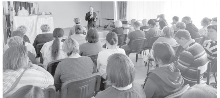
● Встреча депутатов с трудовым коллективом СЛШ№2 п. Усть-Камчатска

Кроме того, участникам встречи напомнили о возможностях целевого и внебюджетного обучения. Шанс получить бесплат-