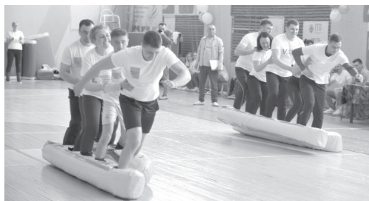
■ «Весёлые старты» в п. Усть-Камчатке

Наконец, после подсчёта баллов, были объявлены результаты. Победу одержала команда средней школы № 2 «Сириус». Второе место заняли работники больницы «Рваные кеды». Бронза у пограничников команды «Гранит», а четвертое место у сотрудников администрации.