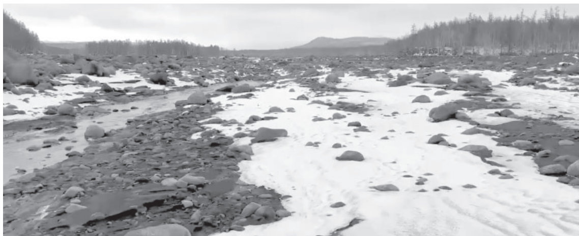
☉ Защитная насыпь на реке Студёная

- Напомню, общими усилиями нам удалось восстановить защитную насыпь, чтобы повернуть её течение по безопасному направлению. Ситуация пока не вызывает опасений, но превентивные меры необходимы, чтобы не допустить повторения ЧС. Прорабатываем возможные сценарии развития событий. В ближайшее время на место прибудут геодезисты, и на основании их анализа и прогнозов сделаем выводы по принятию со-