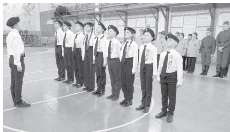
«Витязи» СШ № 6 п. Козыревска на строевой подготовке

В последнем испытании для ребят военные подготовили полосу препятствий со стрель-