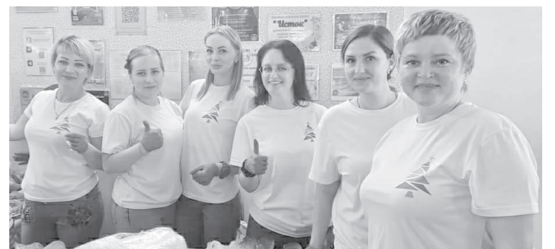
Благотворительная ярмарка в п. Ключи