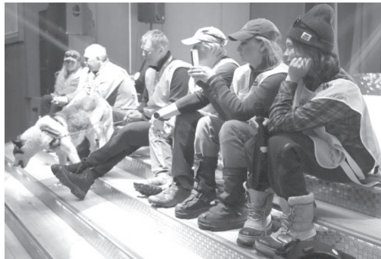
📷 Общение с каюрами

Невозможно представить гонку без собак и каюров, это знает каждый. Но есть люди, чьи подвиги остаются за кадром. Те, кто принимает важные решения, кто отвечает за здоровье четвероногих. Тот, кто обеспечивает питанием всю группу гонки, а также те, кто прокла-