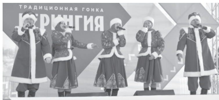
📷 Концертная программа на финише «Берингии-2024»