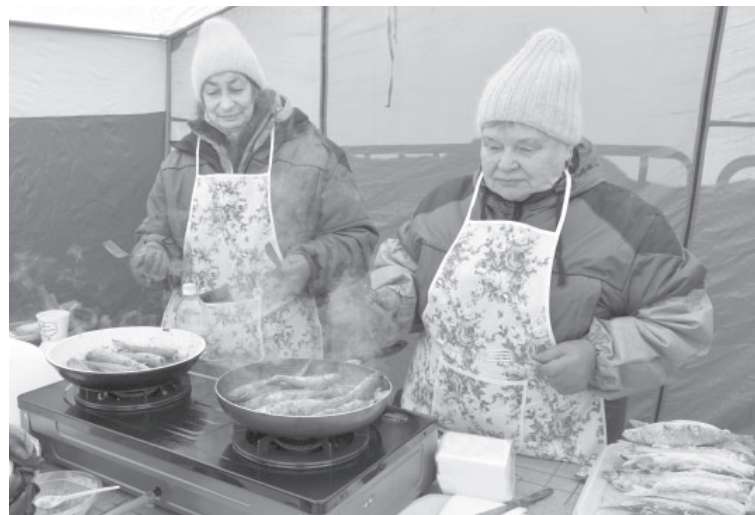
📷 Бесплатное угощение жареной усть-камчатской корюшкой