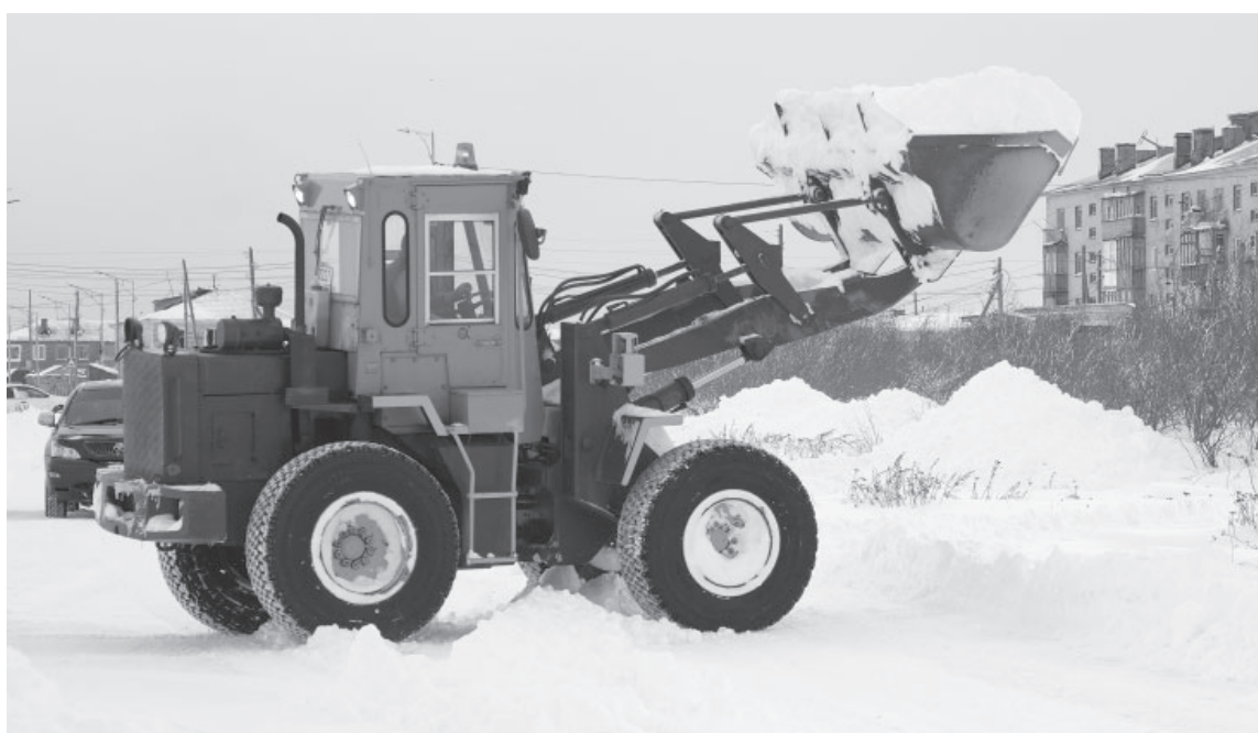
● Расчистка улиц в п. Усть-Камчатске

В Козыревском поселении расчистку работники местного «Тепловодхоза» вели двумя единицами техники: по одной в посёлке Козыревске и селе Майском. Уровень выпавших осадков здесь минимален.