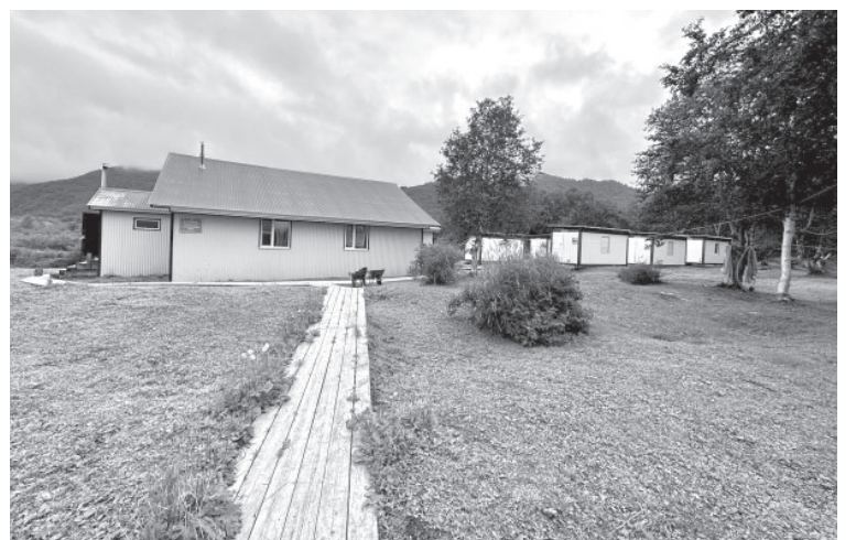
Научно-исследовательская биологическая станция «Радуга»