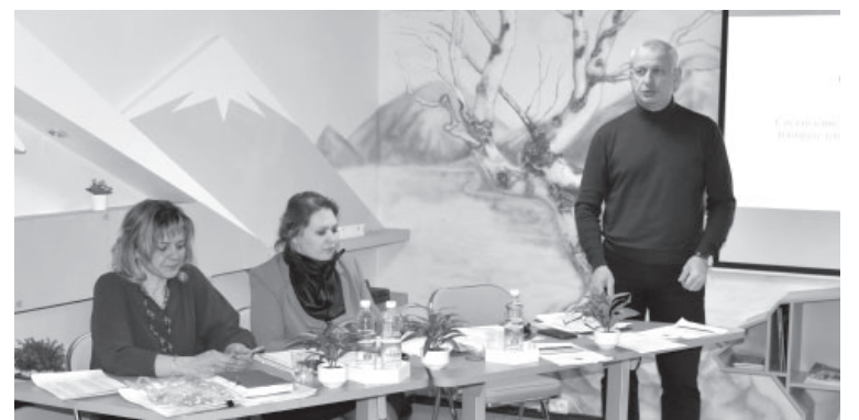
Члены Усть-Камчатской ТИК

31 января свои кандидатуры сняли выдвигенец от Российской партии свободы и справед-