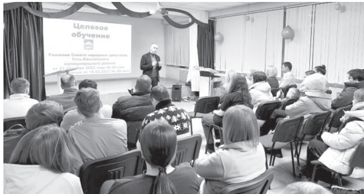
📷 Встреча по целевому обучению в СШ №2 п. Усть-Камчатска

Образование. Школьникам и их родителям рассказали о возможности бесплатно получить среднее или высшее профессиональное образование.