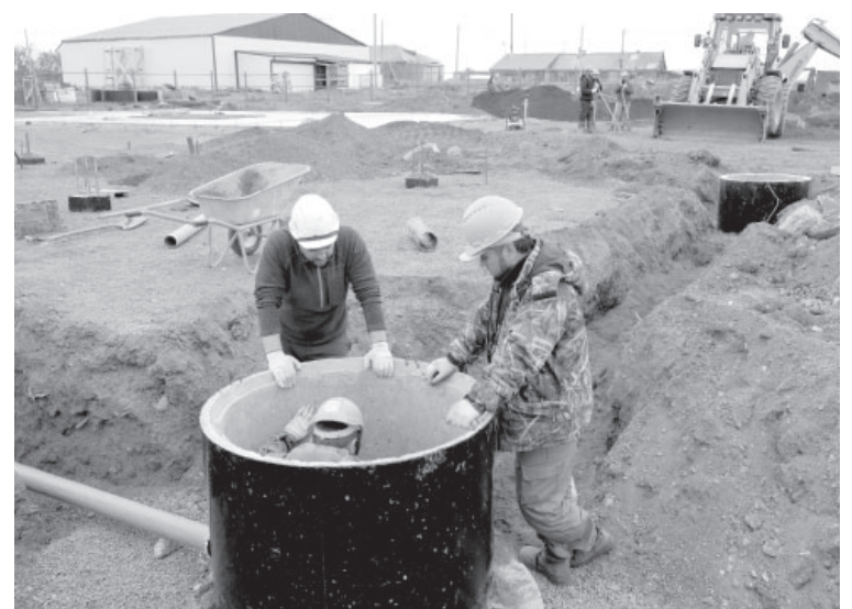
Строительство здравпункта в селе Крутоберёгово

В конце 2023 года на Камчатке ввели в эксплуатацию объекты первичного звена здравоохранения в Елизовском муниципальном районе – в посёлках Березняки и Новый, а также в селе Алука в Олюторском муниципальном районе. А в январе 2024-го – в селе Крутоберёгово Усть-Камчатского района.