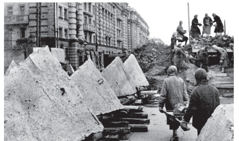
📍 Возведение оборонительных сооружений на улицах Ленинграда в годы блокады

Красная армия действовала по плану. К 17 января 1944 года прорвала оборону противни-