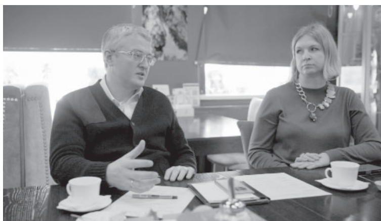
📷 Встреча губернатора В. Солодова с участниками программы «Муравьёв-Амурский 2030»

Люди. Глава Камчатки встретился с участниками программы «Муравьёв-Амурский 2030». Участники встречи рассказали о том, почему приехали на Камчатку и поделились мнением о жизни и работе в регионе.