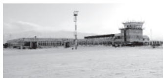
Аэропорт в п. Усть-Камчатске