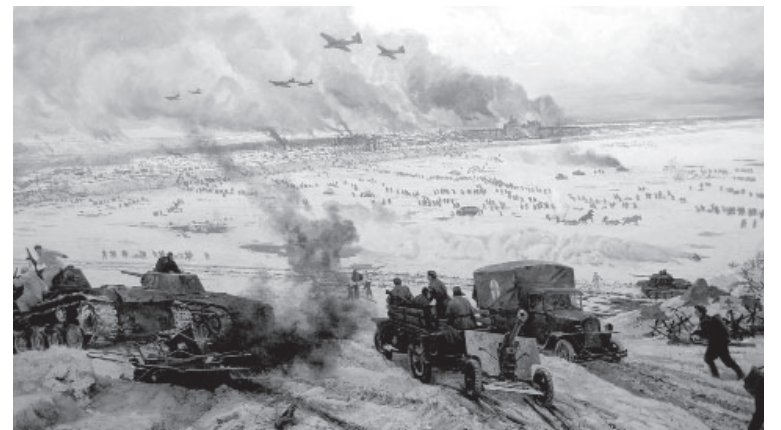
📍 Операция по освобождению Ленинграда

ка. Танки Т-34 вышли к Ропше. Немецкие силы оказались под угрозой окружения между Ленинградом и Ораниенбаумским плацдармом. Фашисты стали отступать.