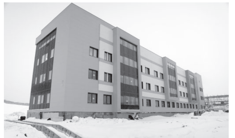
📷 Построенный корпус новой краевой больницы

После установки оборудования и отделочных работ, завер-