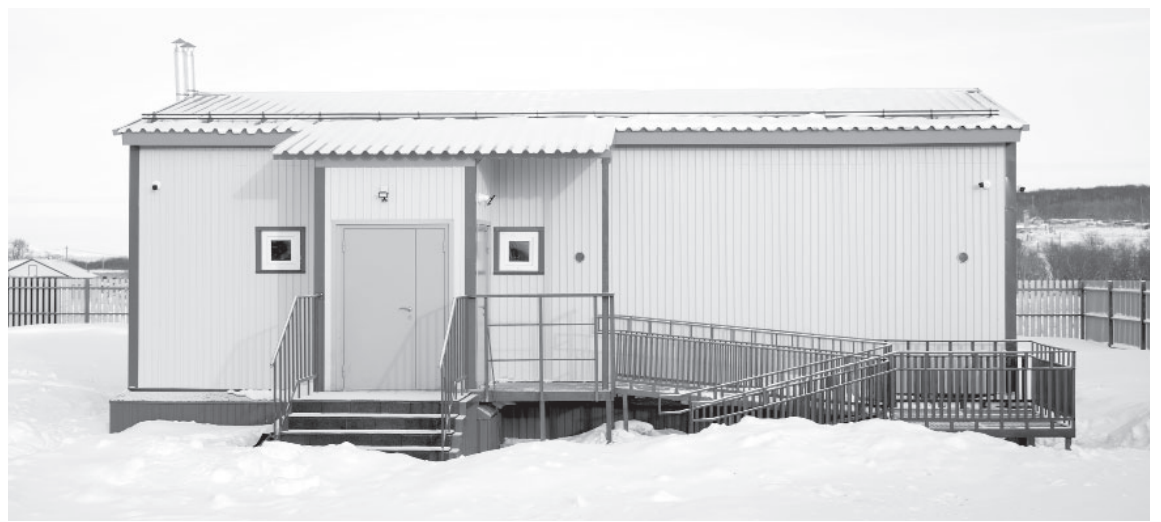
Фельдшерский здравпункт в селе Крутоберёгово

«В Сосновке осталось завершить ремонт ФАПа, новый фельдшерско-акушерский пункт будет создан в Термальном и посёлке Двуречье. Дальше будем делать акцент на севера. Уже построены ФАПы в Алуке, Слаутном, достраивается в Аянке, сдан в Крутоберёгове Усть-Камчатского района. Далее перед нами стоит задача по строительству таких объектов в посёлках западного побережья, например, в Хайрюзово. Отмечу, что мы обкатываем новые технологии строительства. В качестве примера при-