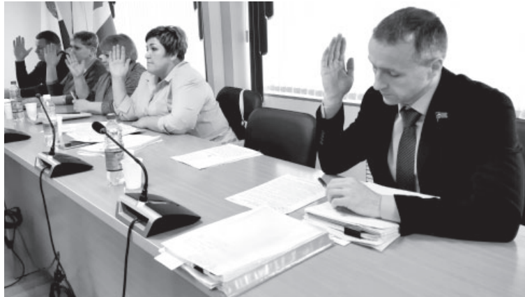
Сессия СНД Усть-Камчатского района

В Усть-Камчатске прошли очередные сессии депутатов поселения и района. Традиционно их основной темой стал бюджет.