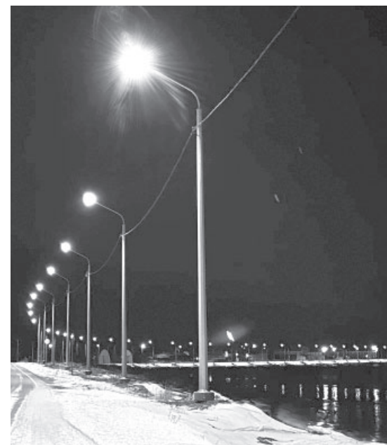
📷 Опоры новой линии освещения