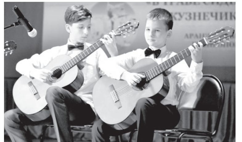
Концертная программа юбилея ДШИ №1 п. Ключи

«Я сегодня присутствовал на сцене в составе хореографического коллектива «Адекс». У нас был энергичный молодежный танец. Во время первой части концерта выступали учащиеся и преподава-