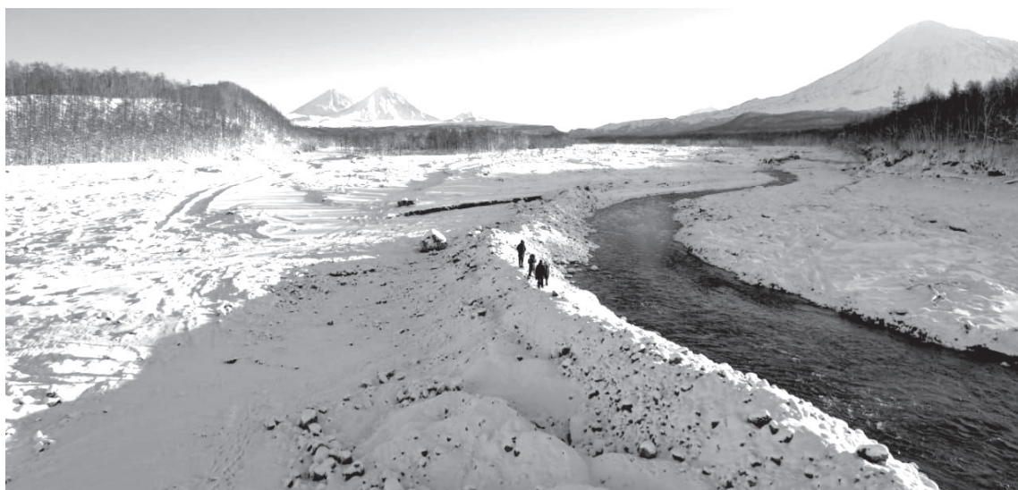
📷 Дамба на реке Студёной

Во время вертолётного облёта территории учёные подтвердили факт разрушения за-