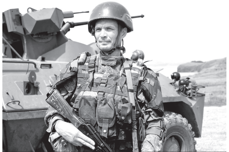
■ Участник СВО

В феврале 2023 года бойцы 40-й бригады морской пехоты вместе с камчатскими танкистами и подразделениями 155-й отдельной бригады морской пехоты начали ожесточенный штурм города Угледар в Волноваском районе