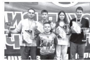
■ Участники команды из Усть-Камчатского района