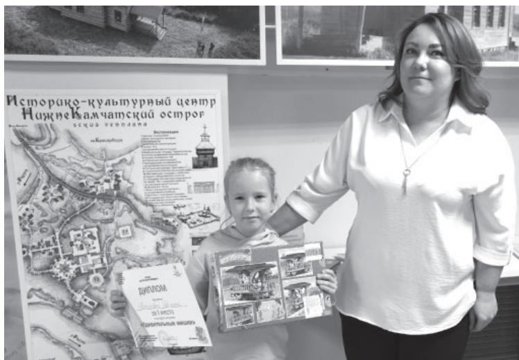
■ Награждение участников конкурса рисунков