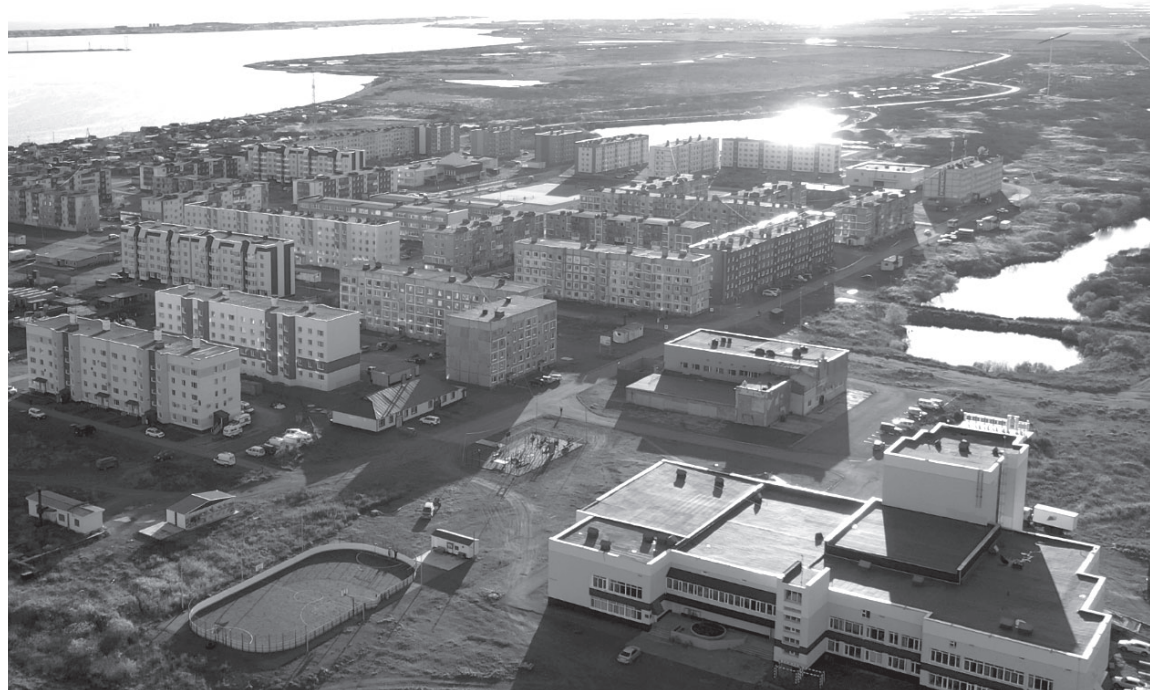
Микрорайон Погодный посёлка Усть-Камчатск

В этом году отремонтирован участок трубопровода на станции первого подъёма подрядчиком ООО «Дороги Камчатки». Работники МУП «Водоканал Усть-Камчатского сельского поселения» заменили в микро-