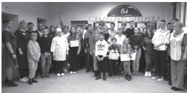
■ Единый день открытых дверей в КИТе