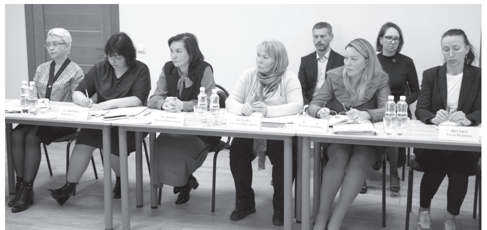
■ Заседание межведомственной комиссии по поддержке участников специальной военной операции

В настоящий момент обеспечение нуждающихся в технических средствах реабилитации ведётся несколькими структурами. Те протезы, которые устанавливаются по линии Минобороны РФ, высокотехнологичны и позволяют продолжать активную жизнь. Кроме того, обеспечение протезами осуществляет Социальный фонд России, где есть несколько способов обеспечения: либо протез покупает сам фонд, либо выдаётся электронный сертификат, которым гражданин может воспользоваться само-