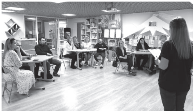
■ Игра-экоквиз «Место силы»

Экоквиз «Место силы» было завершающим мероприятием в рамках реализации проекта Усть-Камчатского общества охотников и рыболовов «Осторожно! Медведь!».