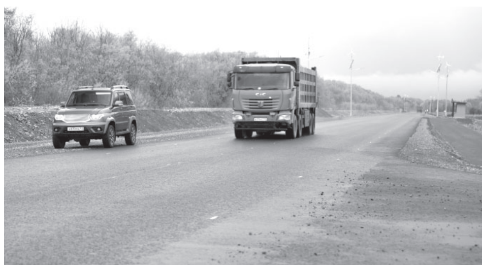
■ Асфальтирование дороги от Мильковской трассы до села Пиначево на Камчатке

самым крупным сельскохозяйственным предприятием в Камчатском крае. Данная дорога является единственной артерией, соединяющей Раздольный, Пиначево и Кеткино с районным и краевым центрами, единственной артерией, соединяющей агропарк «Зеленовские озёрки» с общей сетью дорог», — сообщили в Министерстве транспорта и дорожного строительства Камчатского края.