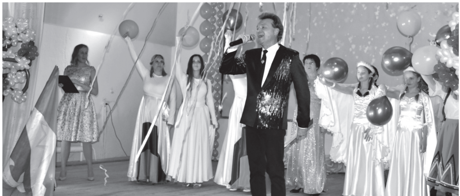
■ Концерт, посвящённый столетию со дня образования села Крутоберёгово

Мероприятия. В Крутоберёгове состоялся праздник, посвящённый 100-летию со дня образования села!