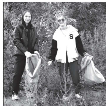
📷 Участники «Чистых Игр»

Мероприятие состоялось при поддержке Фонда президентских грантов, ЭКО «КамЧа», Министерства развития гражданского общества и молодёжи Камчатского края.