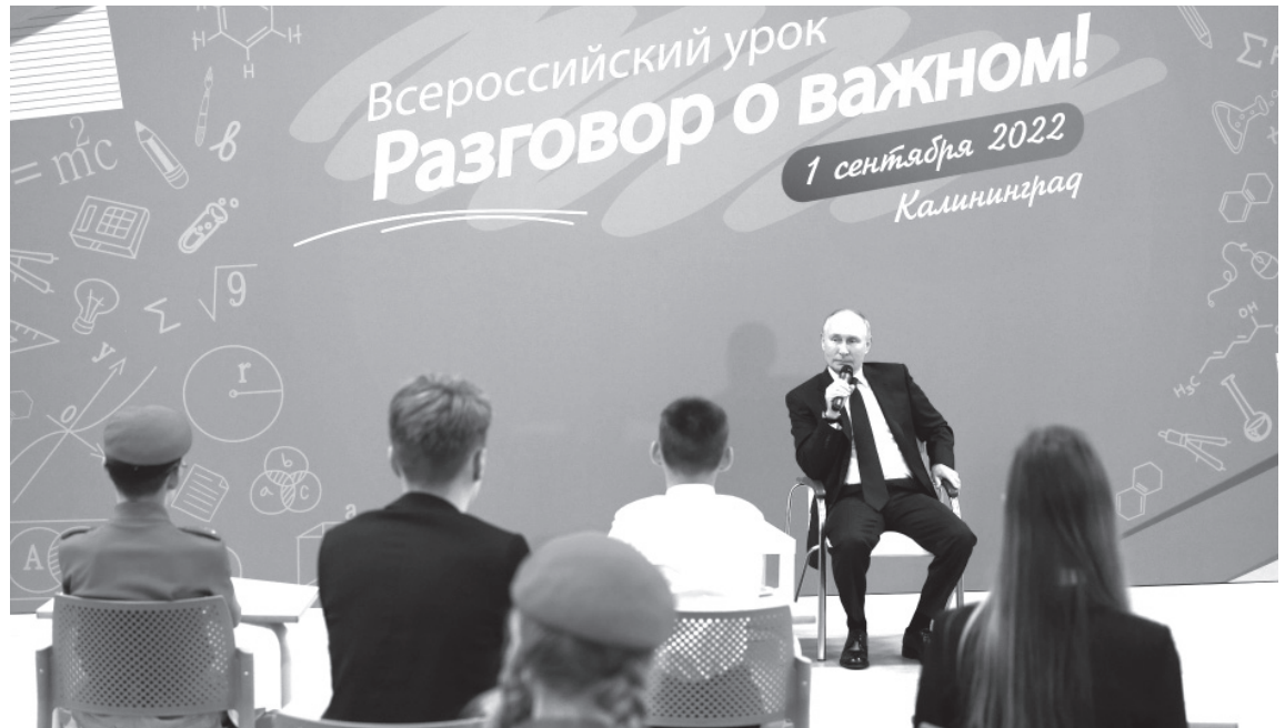
Президент на Всероссийском уроке «Разговор о важном»

Путин напомнил, что свои успехи есть во всех регионах