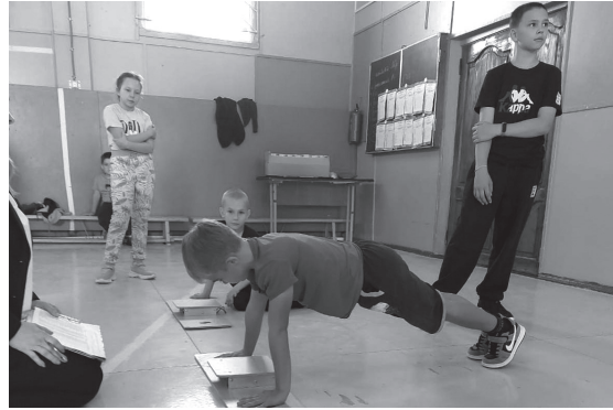
📷 Сдача нормативов

Участие в фестивале способствует не только физическому развитию, но и формирует здоровый образ жизни и умение работать в команде.