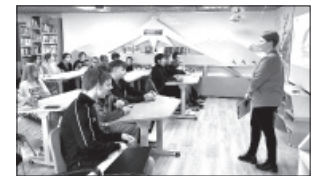
📷 Литературный диктант

«Литературный диктант» - это международная просветительская акция, которую организовала Мурманская областная научная библиотека в 2021 году. В 2023 году к акции присоединились уже более 700 площадок из России и стран мира! Участники ответили на 20 вопросов, посвящённых русской литературе от классики до современности. Три из них были посвящены литературе Камчатки. Правильные ответы и итоги диктанта будут размещены в социальных сетях библиотеки 27 сентября. Участники, набравшие максимальное количество баллов, будут награждены как победители.