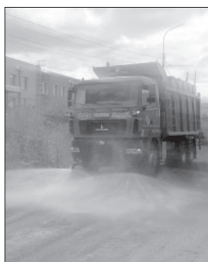
● Поливомоечная машина в работе

мощность двигателя – 300 л. с., объём самосвального кузова – 19 куб. м, объём цистерны – 12 куб. м, ширина убираемой полосы – 2,5 м, грузоподъёмность – 19 тонн, год выпуска – 2023, страна-производитель – РФ.