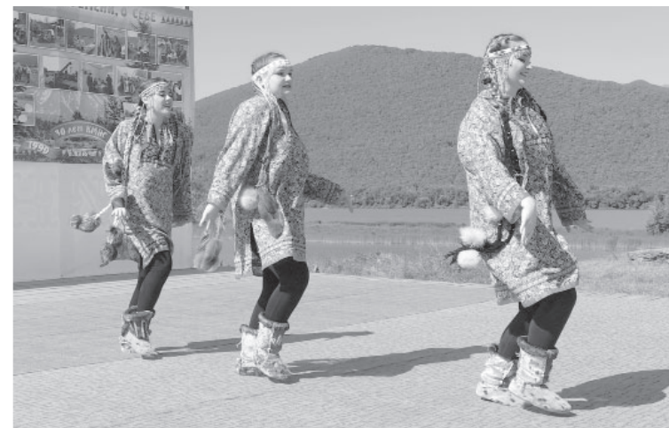
День аборигена в Ключах, 2022 г.