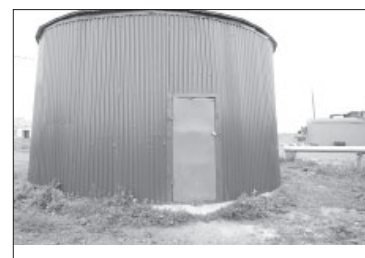
📷 Канализационная насосная станция № 3 в мкр. Посёлок Новый

В настоящее время работники водоканала УКСП приступили к аналогичным работам на канализационной насосной станции №4, расположенной также в мкр. Посёлок Новый.