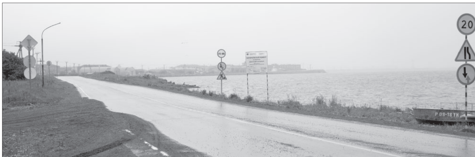
● Подготовка участка региональной автодороги к установке опор новой линии освещения

Инфраструктура. В Усть-Камчатске от дебаркадера до выезда на автодорогу в микрорайон Погодный появится освещение!