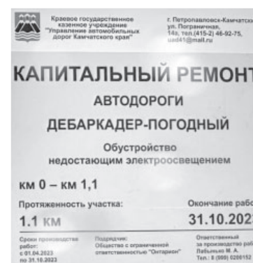
● Паспорт объекта капитального ремонта автодороги «Дебаркадер - Погодный»

Он добавил, финансируется проект из регионального бюджета, размер его превышает 22 млн рублей. Срок окончания работ – 31 октября 2023 года.