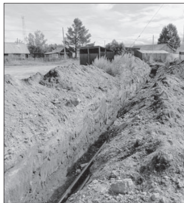
📷 Замена ветхих сетей отопления в п. Козыревске

Подрядчик всех указанных работ – ООО «Стройрыбвосток» п. Нагорного Елизовского района.