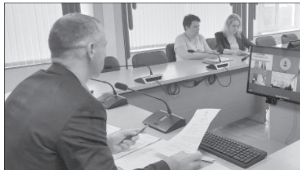
📷 Заседание постоянных депутатских комиссий

Помимо этого, на два месяца увеличен срок рассмотрения комиссией вопроса о направлении жителей на обучение – с 20 июня на 20 августа.