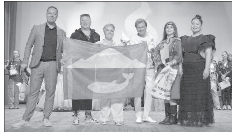
Общее фото на конкурсе-фестивале «Новые огни» с флагом Усть-Камчатского района

– Хотелось бы сказать спасибо всему коллективу Центра культуры и досуга за то, что они поддерживали нас, помогали разобраться с возникающими проблемами! Марии пришлось быстро учить новый репертуар, так как она на тот момент вернулась с другого конкурса. Так же благодарим всё руководство Центра культуры и досуга за предоставленную возможность поучаствовать в данном конкурсе.