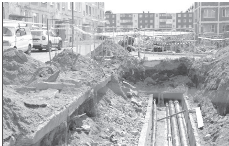
📷 Замена ветхих сетей отопления в п. Усть-Камчатске