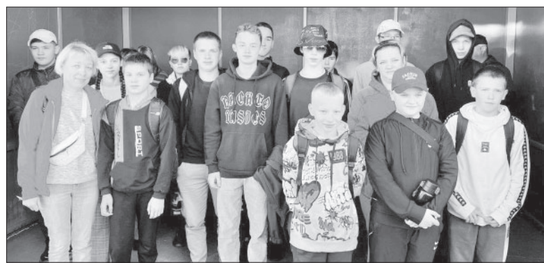
Дети п. Козыревска ждут отправления в ВДЦ «Океан»

1. В первую очередь, убедитесь, что ни вам, ни пострадавшему ничего не угрожает. По возмож-