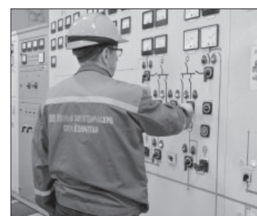
● Проверка оборудования

Наряду с плановыми отключениями ведутся и внеплановые. На территории райцентра на сегодняшний день работают две подрядные организации, которые выполняют ремонтные работы по высоковольтной линии Л-352 (покраска опор и перетяжка провода), а также вводят в эксплуатацию линию, которую уже окрасили.