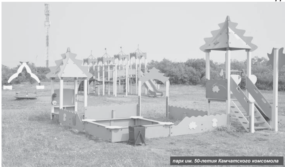
парк им. 50-летия Камчатского комсомола