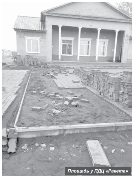
Площадь у ПДЦ «Ракета»

В рамках регионального проекта «Обеспечение качественно нового уровня развития инфраструктуры культуры»