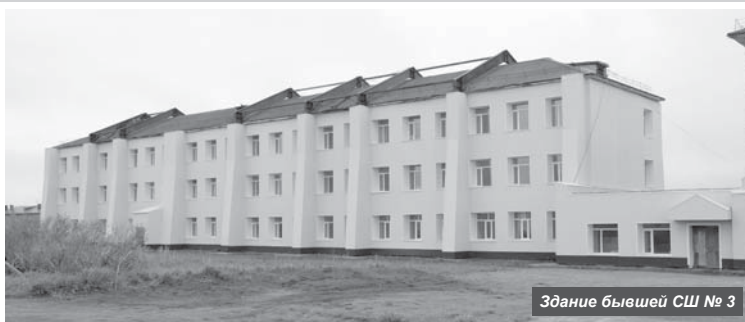
Здание бывшей СШ № 3

- При таких финансовых обстоятельствах данное учреждение существовать не может. Для дальнейшего функционирования аптеки необходимо погасить образовавшиеся долги. Если такой выход не найдётся, тогда учреждение будет ликвидировано. Весь имеющийся