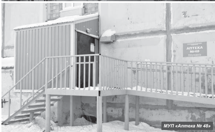
МУП «Аптека № 48»