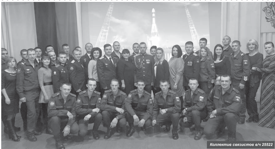
Коллектив связистов в/ч 25522

20 октября военные связисты отмечают профессиональный праздник. На протяжении долгих лет такие специалисты научно-испытательной станции посёлка Ключи всегда были важным звеном полигона Кура.