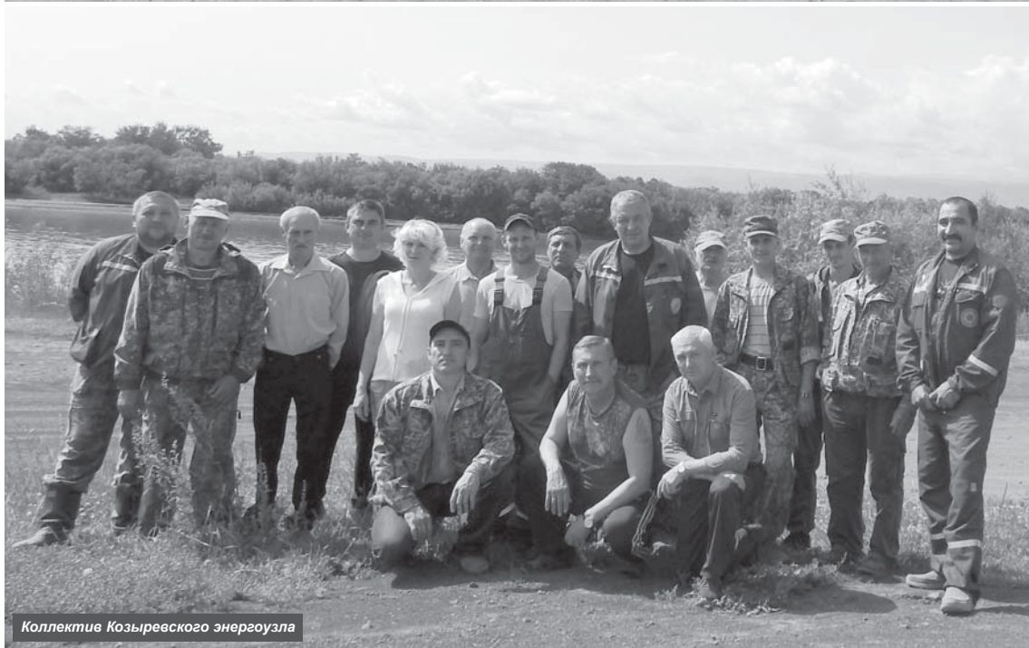
Коллектив Козыревского энергоузла