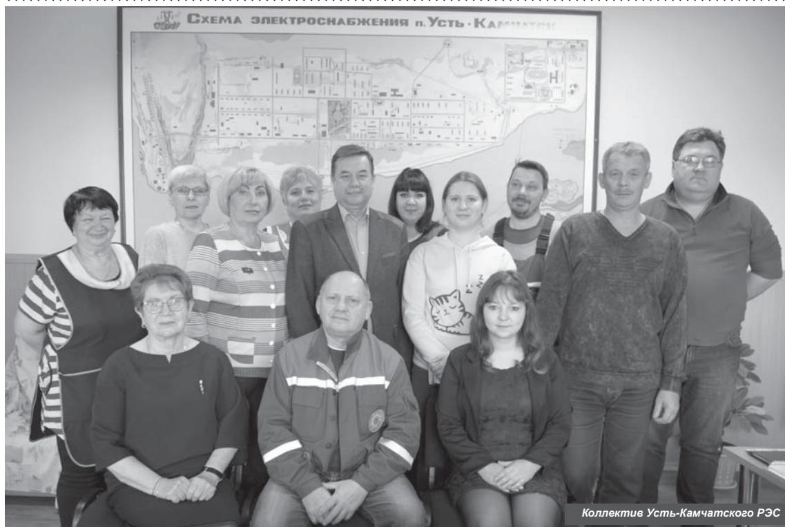
Коллектив Усть-Камчатского РЭС