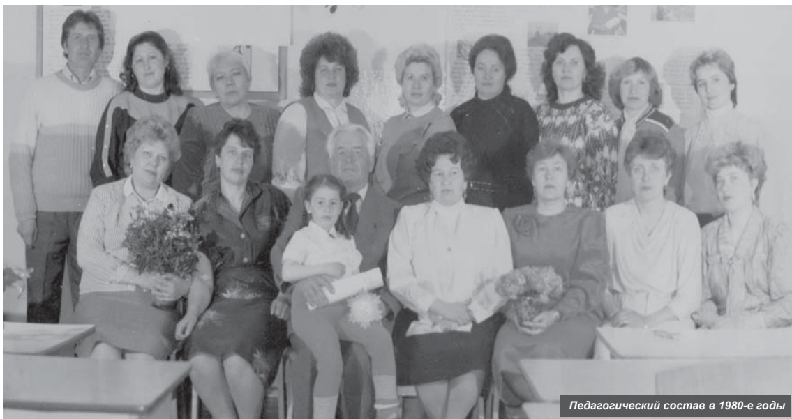
Педагогический состав в 1980-е годы

1 сентября 1959 года в райцентре открыла двери образовательная организация, до сих пор дающая среднее образование подросткам и взрослым, которые по разным причинам не смогли окончить дневную школу.