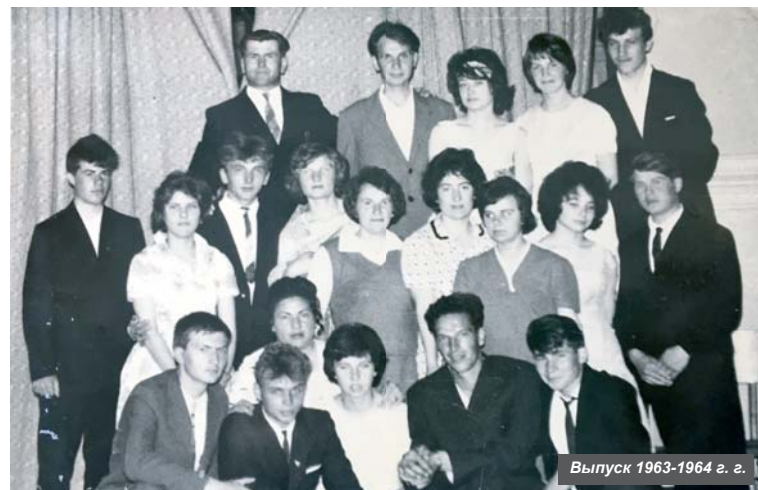
Выпуск 1963-1964 г. г.