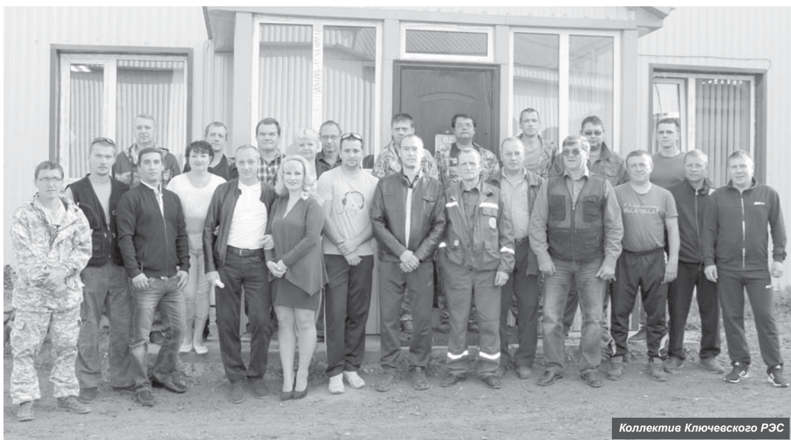
Коллектив Ключевского РЭС