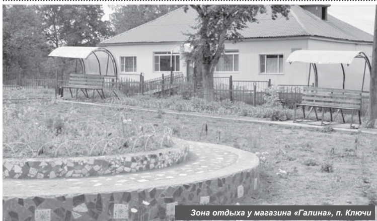
Зона отдыха у магазина «Галина», п. Ключи

Мероприятия по улучшению жизни населения помимо Усть-Камчатского реализуются и в двух других сельских поселениях района.