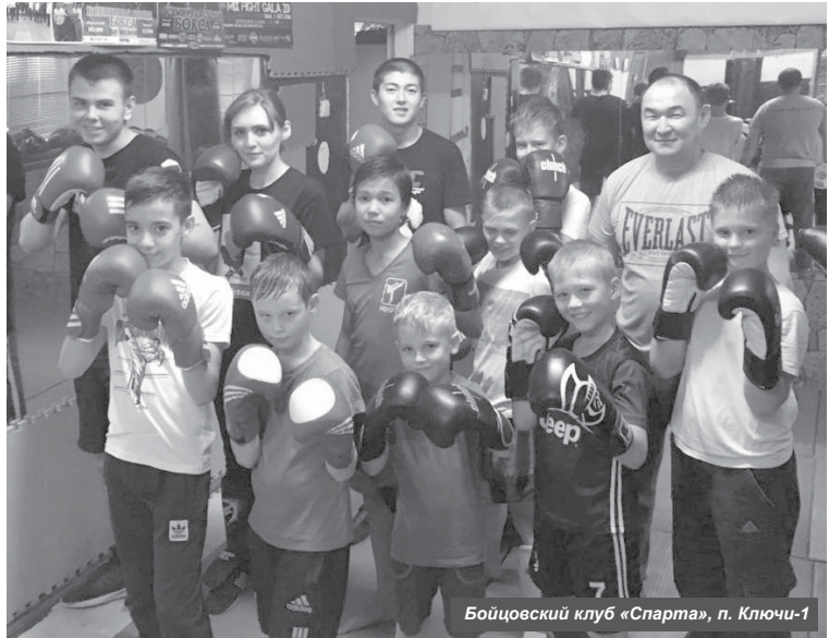
Бойцовский клуб «Спарта», п. Ключи-1