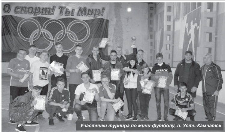
Участники турнира по мини-футболу, п. Усть-Камчатск

В Усть-Камчатском районе прошли спортивные мероприятия в честь Дня физкультурника.