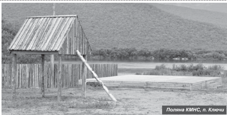
Поляна КМНС, п. Ключи

По желаниям населения посёлка Ключи, прежде всего коренного, мы выбрали для обустройства новое место массовых гуляний — это поляна, расположенная около памятного креста в честь одного из первооткрывателей Камчатки Алексея Чирикова рядом