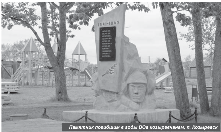
Памятник погибшим в годы ВОВ козыревчанам, п. Козыревск

Ко Дню Ключей на въезде в посёлок со стороны райцентра сдали смотровую площадку, построенную в рамках реализации муниципальной программы Ключевского поселения по благоустройству и на денежные средства из местного бюджета. С облагороженной возвышенности открывается великолепная панорама на здешние пейзажи, и она уже пользуется популярностью у жителей, гостей и туристов.