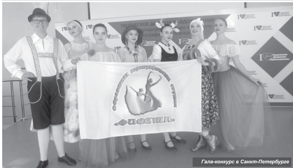
Гала-конкурс в Санкт-Петербурге

На весенних каникулах образцовая хореографическая студия «Фиеста» успешно приняла участие в Международном конкурсе хореографического искусства «ГАЛА-конкурс» в Санкт-Петербурге. Событие, о котором мы будем вспоминать с теплотой.