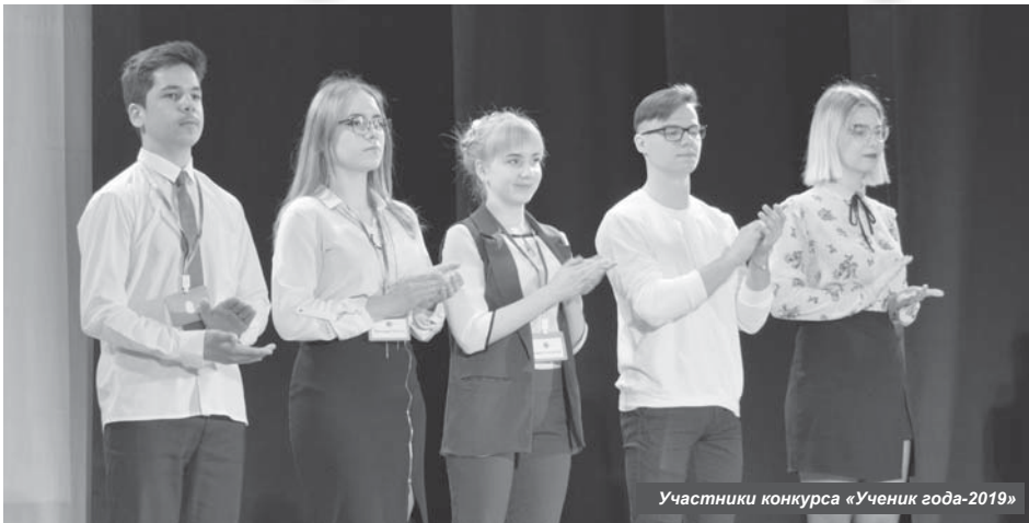
Участники конкурса «Ученик года-2019»

В стенах Центра культуры и досуга Усть-Камчатска состоялся муниципальный этап конкурса «Ученик года — 2019», в этот раз приуроченный к Году театра.