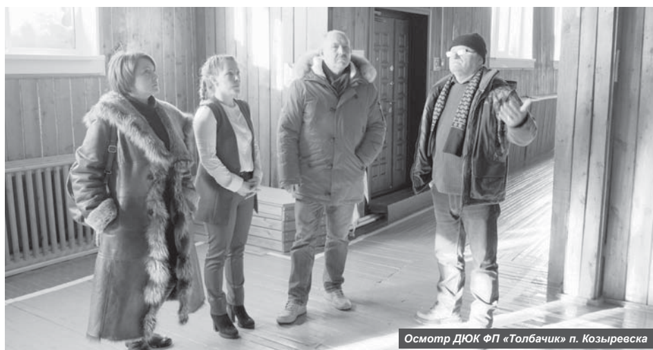
Осмотр ДЮК ФП «Толбачик» п. Козыревска