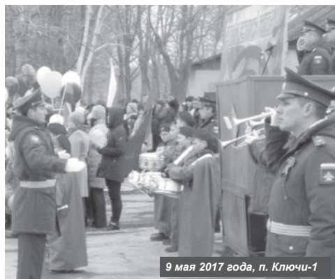
9 мая 2017 года, п. Ключи-1