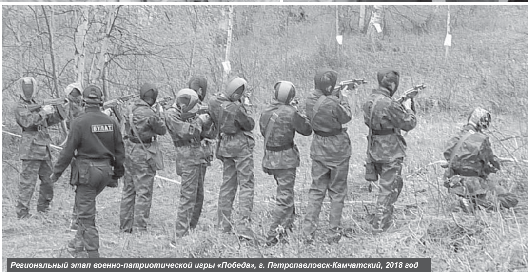
Региональный этап военно-патриотической игры «Победа», г. Петропавловск-Камчатский, 2018 год