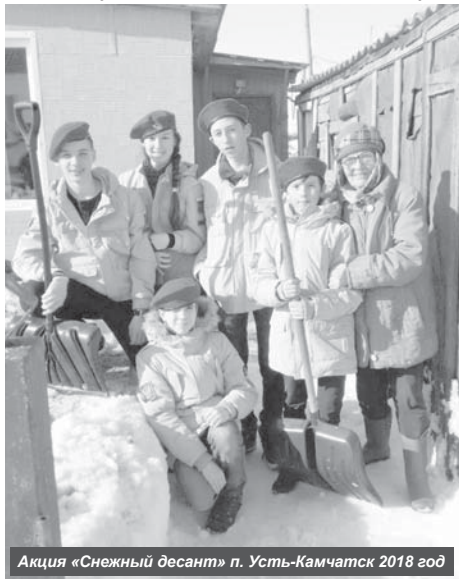
Акция «Снежный десант» п. Усть-Камчатск 2018 год