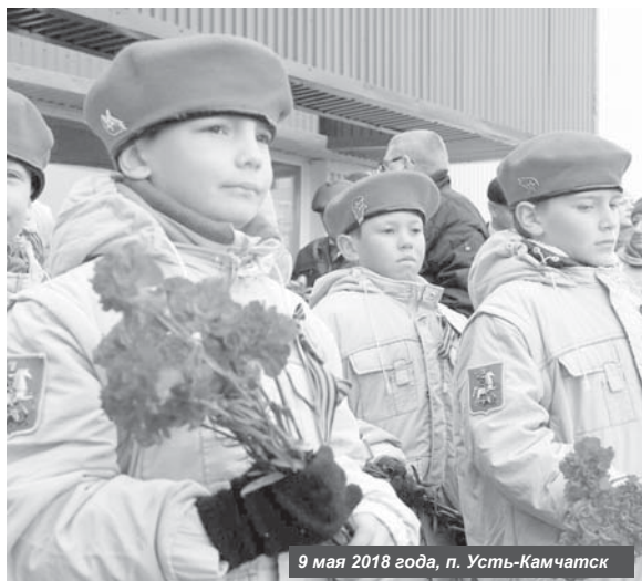
9 мая 2018 года, п. Усть-Камчатск