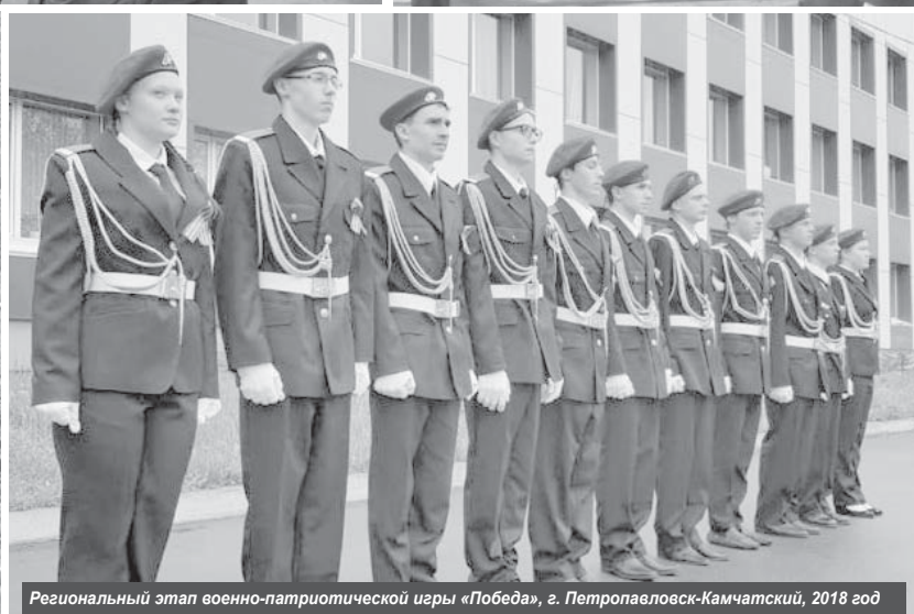
Региональный этап военно-патриотической игры «Победа», г. Петропавловск-Камчатский, 2018 год