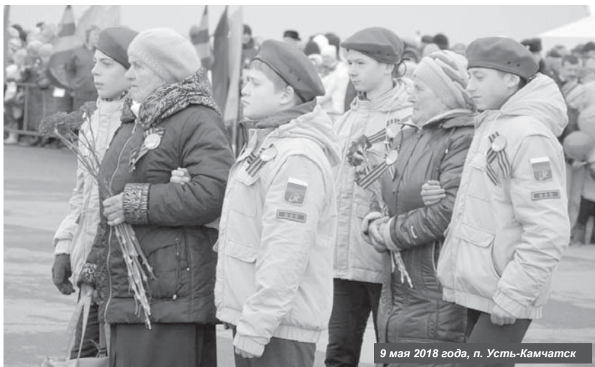
9 мая 2018 года, п. Усть-Камчатск