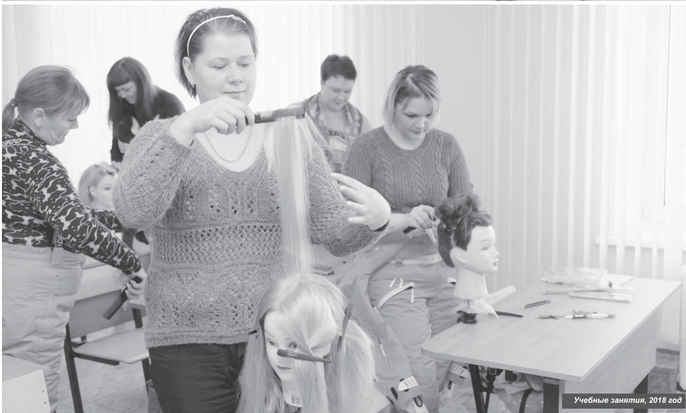
Учебные занятия, 2018 год