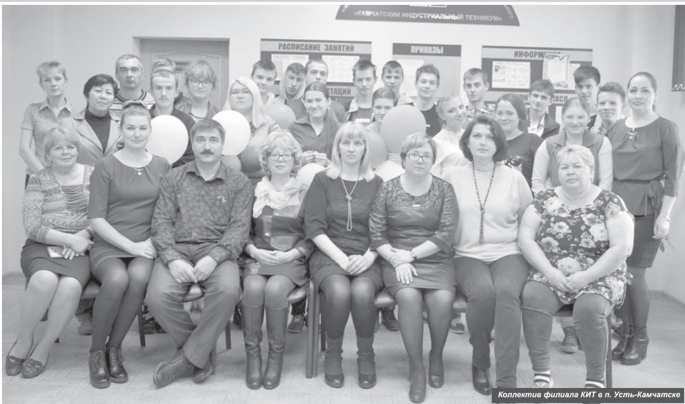
Коллектив филиала КИТ в п. Усть-Камчатске