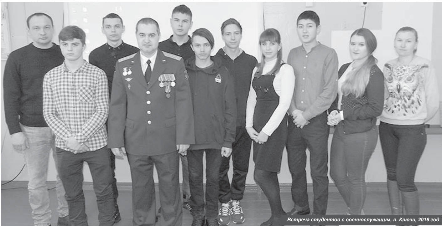
Встреча студентов с военнослужащим, п. Ключи, 2018 год